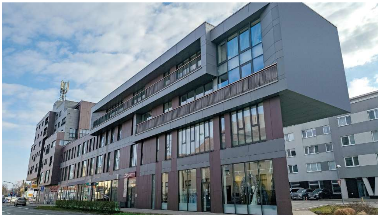
Obr. 1. Polyfunkčná budova, v ktorej sídli Medzinárodné centrum vzdelávania – INTERCEDU, a.s. v Pezinku.

Prostredníctvom multimediálneho portálu INTERCEDU ponúka kontakty, spája akademikov a študujúcich vo vybranom vednom odbore. Základným prvkom