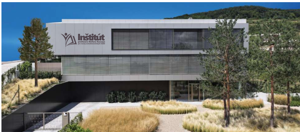
Obr. 2. Budova Inštitútu profesora Štefana Kassaya pre rozvoj socioekonomických štúdií v Limbachu.

S narastajúcou rozmanitosťou, globalizáciou nášho a európskeho spoločenstva zohrávajú významnú úlohu pri ovplyvňovaní sociálno-ekonomických tried aj faktory ako etnicita a kultúrne dedičstvo, pretože príslušníci viditeľných menšín a iných znevýhodnených skupín v porovnaní s ich kaukazskými náprotivkami historicky čelili prekážkam vo vzdelávaní a niektorých profesiách.