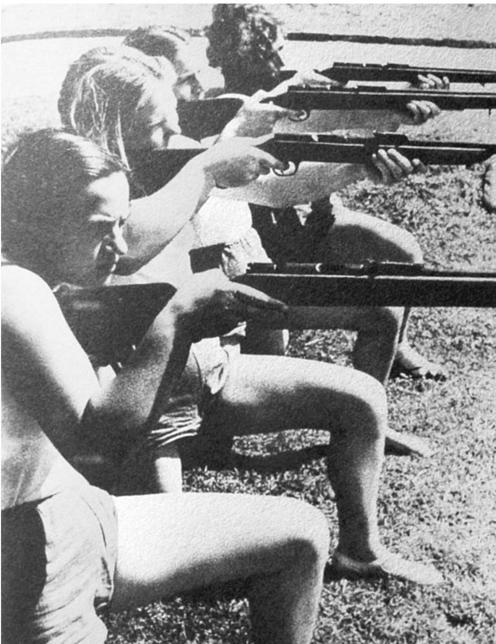
Členky Svazu německých dívek v rámci svého paravojenského výcviku střílejí z pušky, 1936