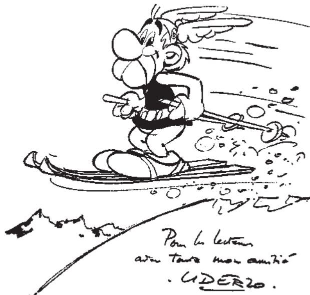
Když byl Albert Uderzo v roce 1969 na dovolené v Megève, nakreslil pro noviny Le Dauphiné libéré Asterixe na lyžích.