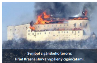
Symbol cigánskeho terorom: Hrad Krásna Hôrka vypálený cigáncami.

Každý zločinec si musí byť vedomý toho, že proti nemu tvrdo nasadíme nielen políciu, ale aj Domobranu! Nebudeme tolerovať ani žiadne čierne stavby. Zlikvidujeme ich všetky - rýchlo a bez rozdielu!