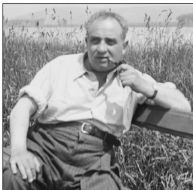
Můj tatínek, 1941