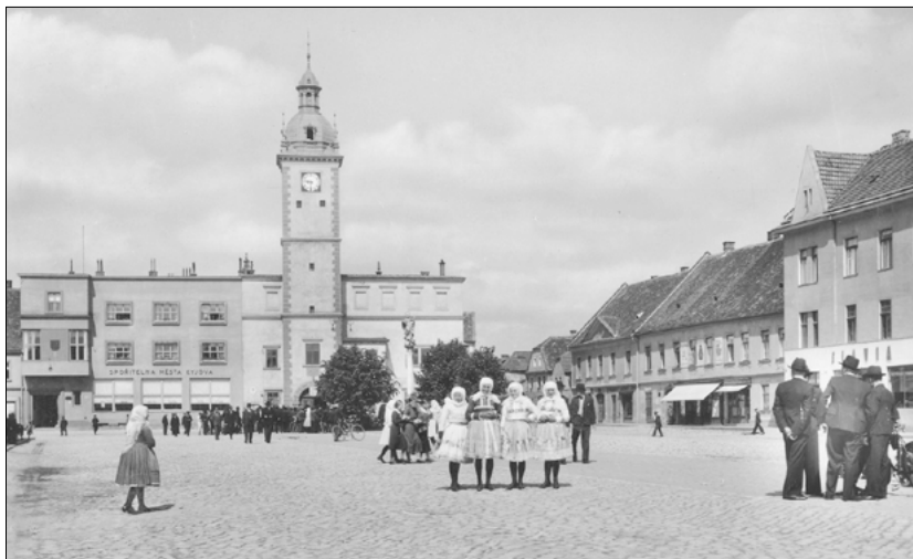
Kyjov/Gaya, hlavní náměstí

Když jsem byla malá, rodiče mě do kavárny moc nepouštěli. Byl úplný svátek, když mne někdy vzali s sebou. Vidím to jako dnes: orchestráště