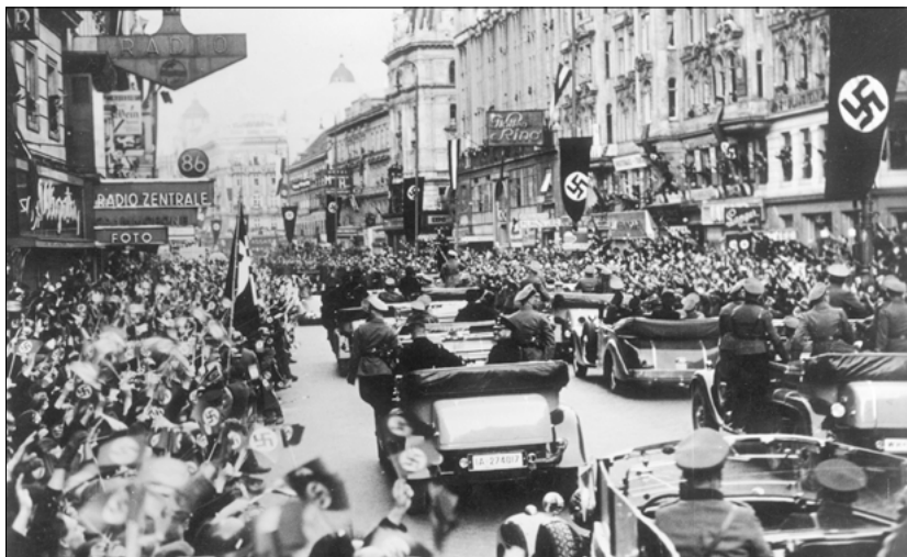
Vpád německých vojsk do Vídně, březen 1938