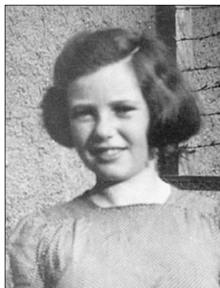
Moje pasová fotografie