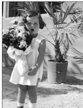
Nahoře: Doma na Mariahilfer StraÙe