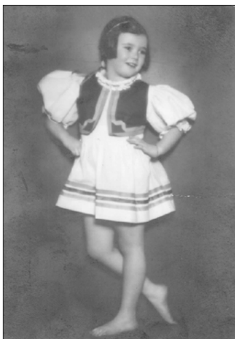
Vlevo: Tančím čardáš