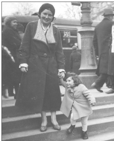
Nahore: Toulky po Vidni s maminkou