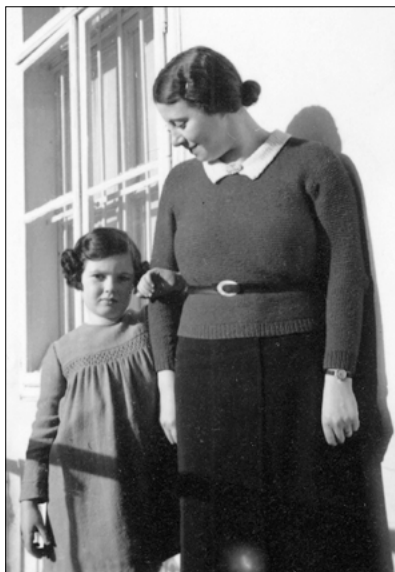
S Johannou, mou „druhou mámou“