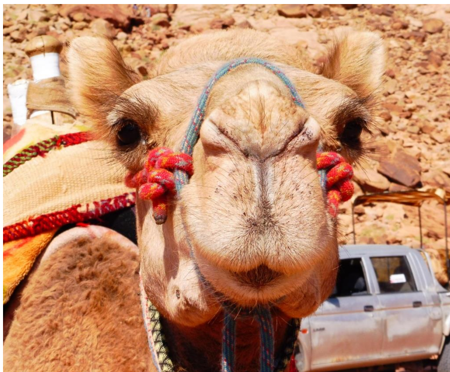
V poušti Wadi Rum mají svůj vlastní dopravní prostředek – dromedáry.

Turistický minibus odjíždí mezi 6 – 6:30 ráno. Přesný čas závisí na poloze vašeho ubytování, neboť autobus vyzvedává turisty postupně před jejich hotelem. Rezervaci místa provede někdo z vašeho bydlení. Požádejte o ni včas. Cena je 8 JD za osobu, doba jízdy činí cca 2 hodiny.