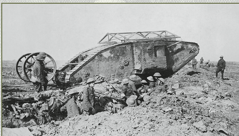
Prvním bojově nasazeným tankem byl britský Mark I. Ten se poprvé na bojišti objevil 15. září 1916.

Je obecně známým faktem, že první tanky bojově nasadili Britové během první světové války na západní frontě, konkrétně pak v září 1916. Velmi brzy se ukázalo, že se jedná o zbraň s opravdu výrazným potenciálem. Jejich výzbroj a pancéřování totiž umožňovaly osádkám přiblížit se k nepřátelským pozicím a likvidovat je bez nebezpečí zásahu z ručních zbraní. Britské velení si od nich slibovalo možnost zlomu v zákopové válce, a proto horečně pracovalo na dalších typech. Přestože se těmto ocelovým monstrům nakonec patovou situací na západní frontě zlomit nepodařilo, ukázalo se, že se jedná o skutečně cenný válečný stroj. Není proto divu, že na jejich vývoji začaly brzy pracovat i další mocnosti.