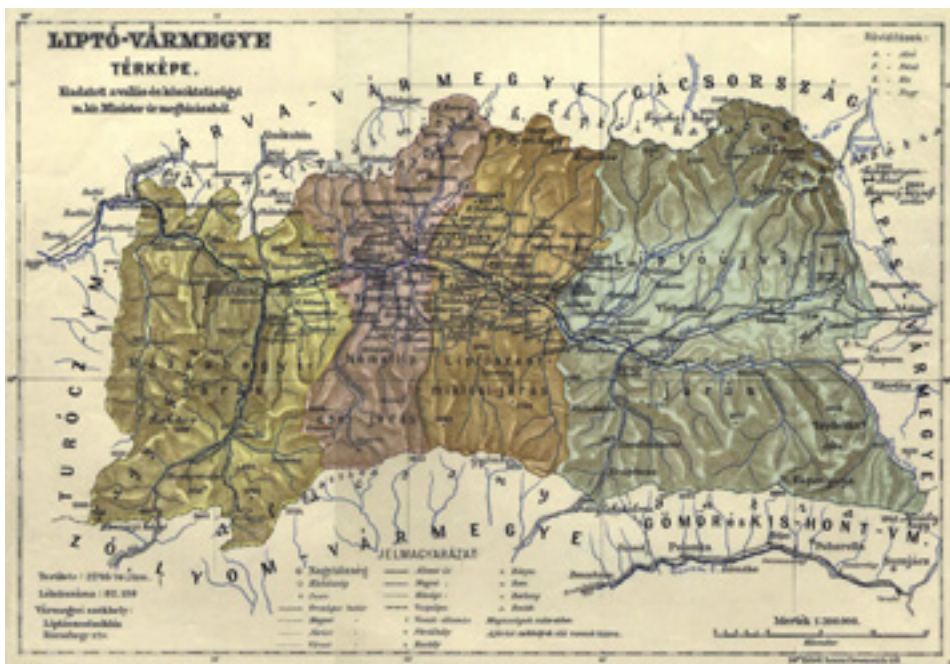
Liptovská stolica – Štrba bola jej najvýchodnejšou dedinou