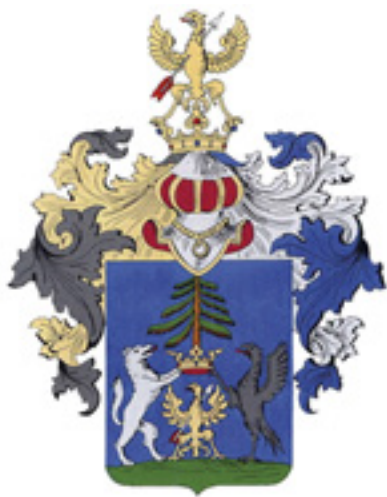
Erb Liptovskej stolice