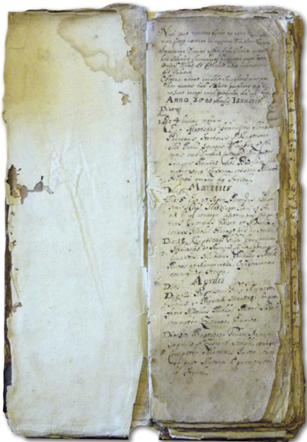
Najstaršia štrbská matrika narodených a pokrstených z roku 1689