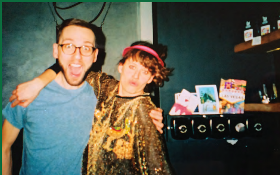
↑ Třetí narozeniny kavárny Industra Coffee, 2016

a naštvané recenze nás ale rychle naučili vycházet našim milým hostům vstříc. Nabídku jsme rychle rozšířili a cukr jsme měli taky (i když nebyl na každém stole, ale pouze na vyžádání na baru).