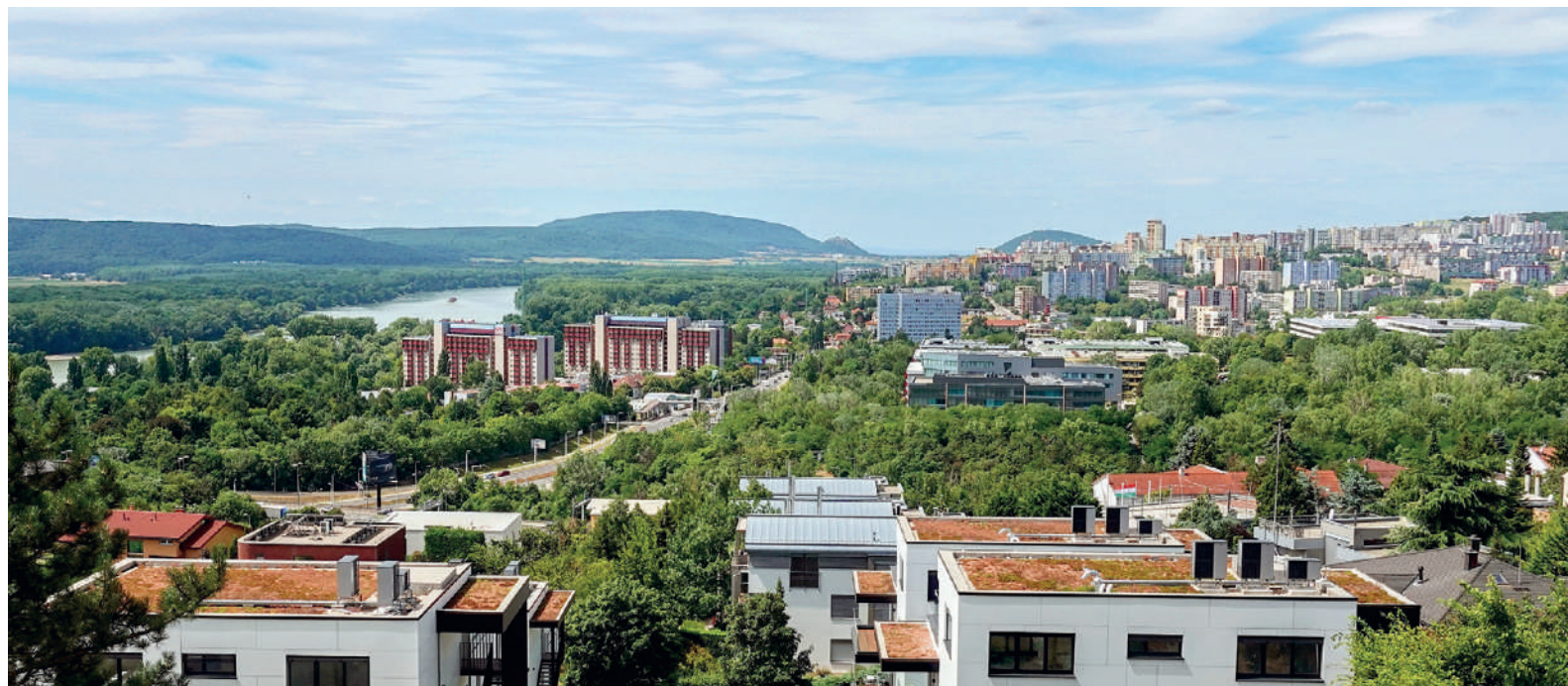
Karlova Ves (2023)

Autorom záberu takmer z totožného miesta v roku 2023 je fotograf Ľubomír Deák. Dokumentuje podstatné zmeny, ktoré sa odohrali na zobrazenom území počas uplynulých deväťdesiatich rokov. S trochou nadsádzky môžeme povedať, že miestami, kde nebudajú zmeny, sú len Dunaj, Hainburské (tiež uvádzané aj ako Hundsheimské) vrchy, hrad Hainburg a kopec Braunsberg na území Rakúska.