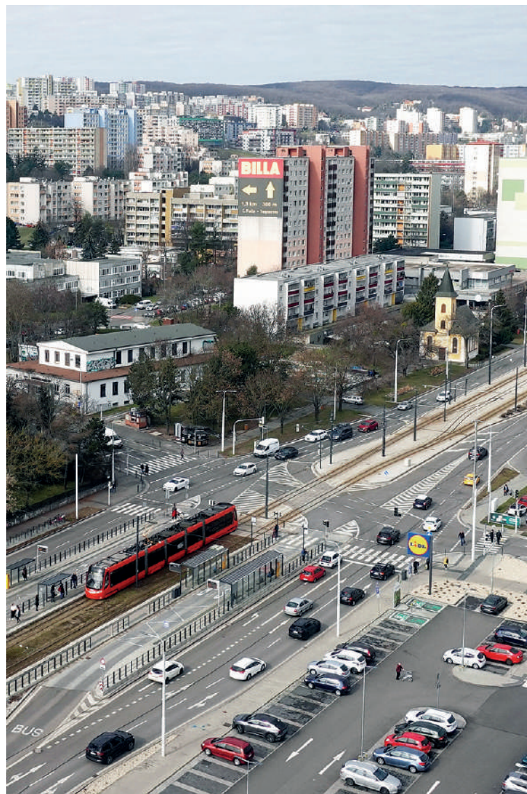
Dom kultúry (2022)