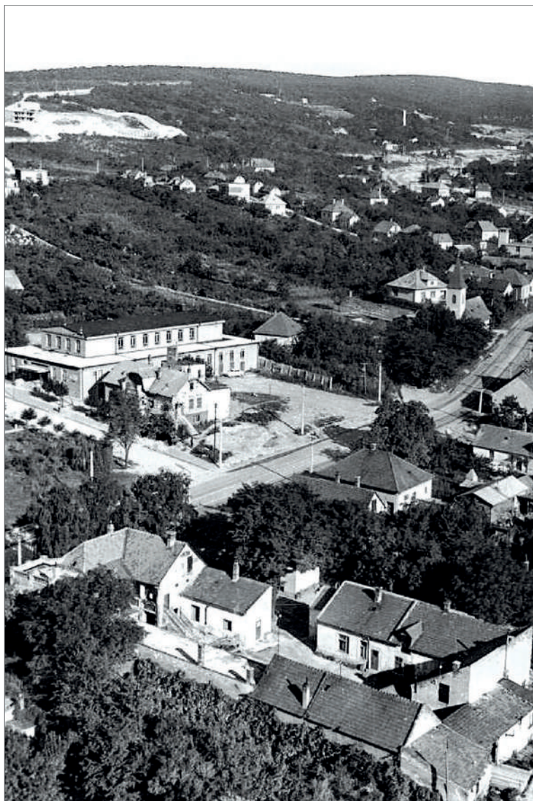
Dom kultúry (1962)