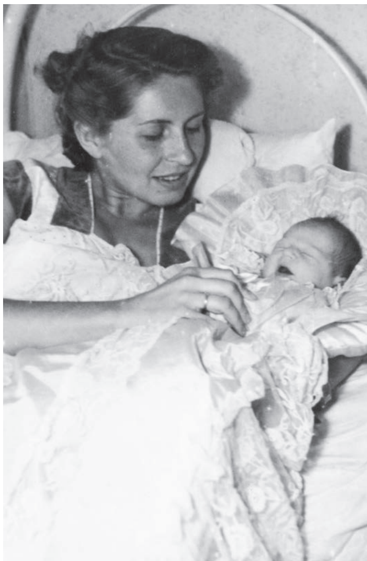
S mámou v porodnici v Bubenči, která už dávno neexistuje...