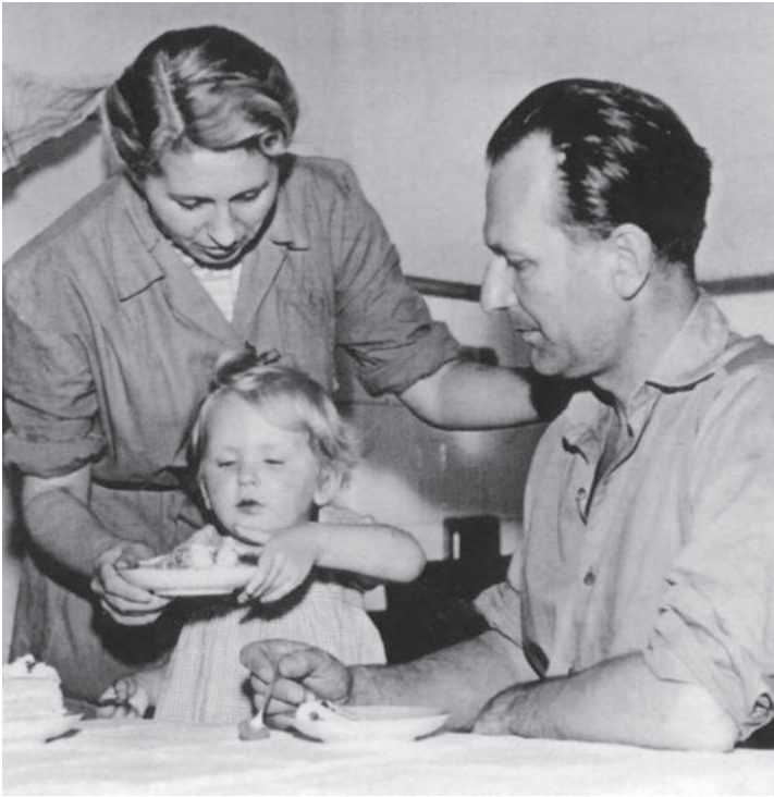
S tátou a mámou u nás doma v kuchyni