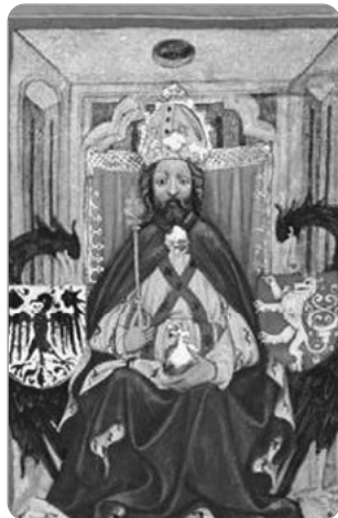
Karel IV. jako český král a římský císař po sobě zanechal dvě závěti, jimiž rozdobil lucemburské panství v Českém království i v německé říši mezi své potomky a příbuzné.

Bohužel, králevicova matka a třetí císařova manželka Anna Svídnická se této korunovace nedočkala. Zemřela v roce 1362, necelého půldruhého roku po Václavově narození.