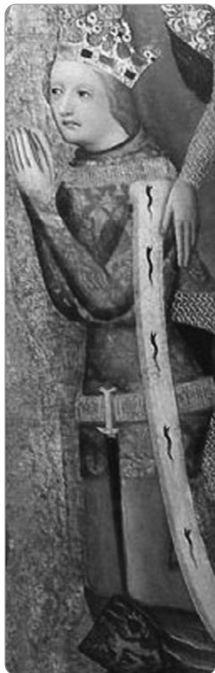
Václav IV. se jako mladý český král nakonec dočkal i koruny římského krále. Oba tituly mu ještě za svého života zajistil otec Karel IV.

Jedním z těch, o koho se nový český a římský král po smrti Karla IV. v počátcích své vlády opíral, byl jeho starší bratranec a moravský markrabí Jošt. Druhým „protektorem“ mladého krále se stala jeho nevlastní matka a císařovna-vdova Alžběta Pomořanská. Právě ona se snažila, aby Václav IV. pokračoval v intencích Karlovy politiky a udržoval v rodě Lucemburků jednotu, kterou považovala