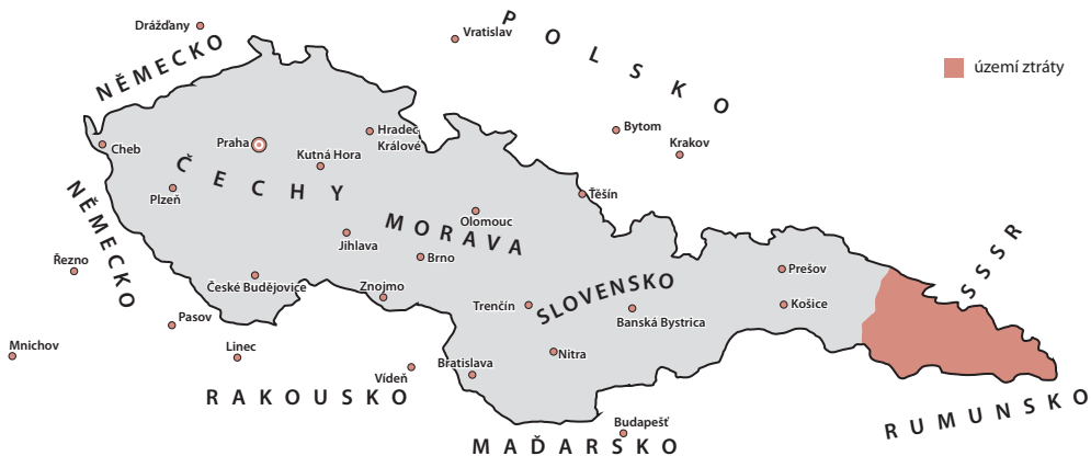
Československo po roce 1945