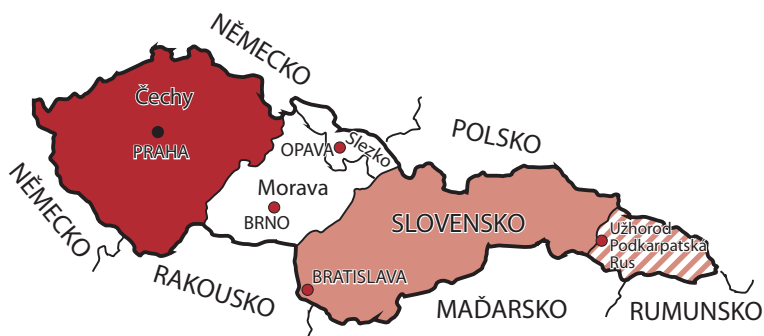
Československo před Mnichovem

nechtěla v tomto prostoru angažovat. Jako garant tedy zbývala jediná velmoc – Sovětský svaz. Vzhledem k tomu, že SSSR uchwátíl i kus východního Polska a Podkarpatskou Rus, považoval ho Beneš za „geograficky středoevropský stát“.