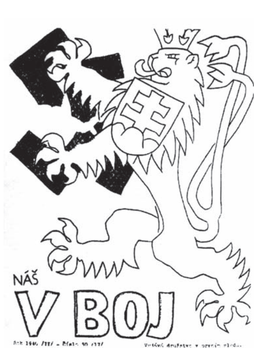
Titulní strana českého odbojového tisku „V boj“

V domácím nekomunistickém (demokratickém) odboji i v londýnském exilu byl princip kolektivní viny zakotven od poloviny roku 1942 (zejména v důsledku tzv. heydrichiády). Komunisté v této otázce neměli zcela jasno. Při moskevských rozhovorech s Benešem v prosinci 1943 proti představě hromadného transferu postavili (jak již bylo uvedeno) zásadu určité diferenciaci uvnitř německé menšiny. Avšak již v srpnu 1944 v rozhovoru s delegací Státní rady Gottwald rozhodně odmítl poskytnout Němcům a Maďarům demokratická práva, dokonce i spoluúčast antifašistů v místních orgánech lidové moci. Komunisté se rozcházel s Benešem v míře určení stupně odpovědnosti v rámci kolektivní viny a v otázce nevinu antifašistů. Obecně lze konstatovat, že princip kolektivní viny jako zásada je nesprávný, a to bez ohledu na formu, v jaké se provádí. Nejenže odporuje demokratické menšinové politice, ale zcela ji vylučuje. Princip kolektivní viny nerozlišuje mezi viníky a nevinými, představuje absolutní nadvládu národa nad menšinou, vítěze nad poraženým. To pak vede k nerespektování zákonů a vytváří základnu masové nezákonnosti. V moderním demokratickém státě je princip kolektivní viny jak z hlediska právního, tak i z hlediska morálního nepřipustný.