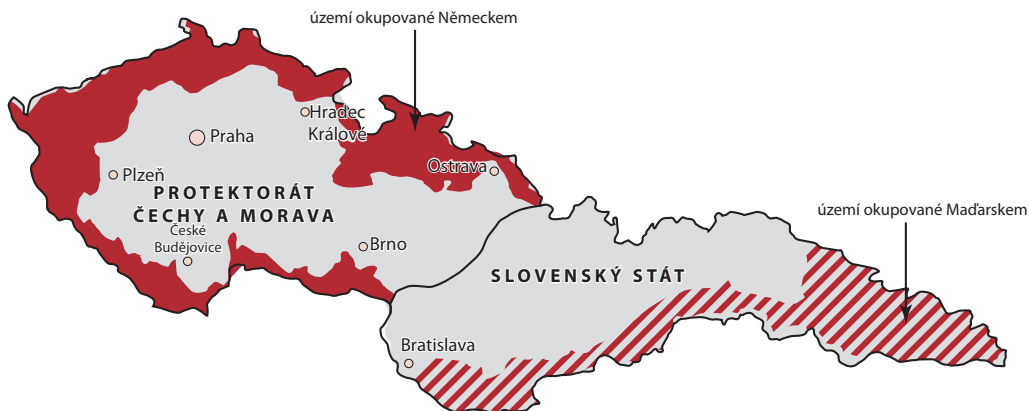
Bývalé Československo v roce 1939