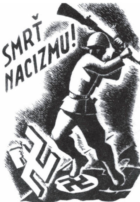
Slovenský protifašistický plakát