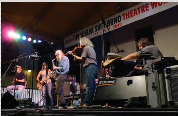
Plastic People of the Universe

V hudbě, kterou protagonisté undergroundu provozovali, můžeme vysledovat jeden podstatný rys: zvažnění. Bylo třeba zřejmě šokujícího bondyovského období u Plastic People of the Universe (PPU) a osvobozujícího smíchu u DG 307 , aby mohly vzniknout (v podstatě bez přímé zpětné vazby početnějšího publika) ucelené cykly PPU Pašijové hry (1978), Ladislavem Klímou inspirované Jak bude po smrti (1979), Co znamená vésti koně (1981) či program rustikální poezie Pavla Zajíčka s nezvykle ukázněným projevem DG 307 Dar stínů . U PPU se stal rozhodující textařskou osobností Vratislav Brabeneč. I hudba Mejly Hlavsy se odklání od rytmické složky rocku a svou podstatou se blíží liturgiím či oratoriu. ( Život v tahu aneb Třicet roků v rocku, Ondřej Konrád, Vojtěch Lindaur, 1990 )