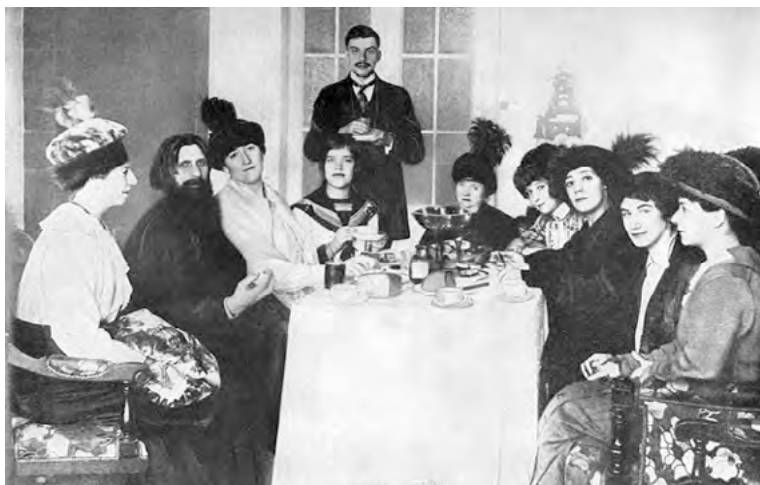
Němcům dodával informace údajně Grigorij Rasputin, pologramotný zázračný léčitel ze Sibiře, který se vetřel do přízně carovy rodiny (na fotografii druhý zleva).

pozice se vypracoval z místa písaře na petrohradském magistrátu a potom reportéra bulvárních novin pomocí burzovních spekulací.