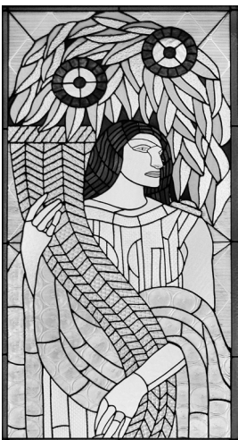
Vitráž podle návrhu Františka Kysely, Baťova vila ve Zlíně