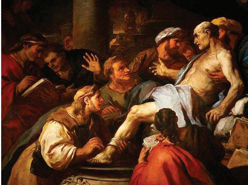
▲ Luca Giordano: Smrť Senecu (olej na plátne, 1684, Louvre, Paríž)