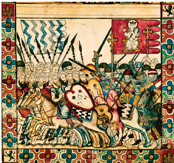
Obr. 31 Bitva na Río Salado

v Guadalupe před touto bitvou modlil a prosil ji o pomoc a ochranu.