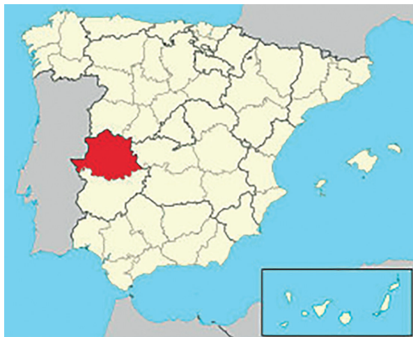
Obr. 28 Provincie Cáceres ve Španělsku

je dnes vesnice s 2 000 obyvateli v provincii Cáceres (obr. 28) ležící v pohoří Extremadura asi 200 kilometrů jihozápadně od Madridu (obr. 29). A u této vesnice se nachází velmi významný královský klášter – Real Monasterio de Nuestra Señora de Guadalupe (obr. 30), zřízený kastilským králem Alfonsem XI. jako poděkování za jeho vítězství v bitvě u Río Salado (obr. 31) v roce 1340, 15 neboť se k Panně Marii