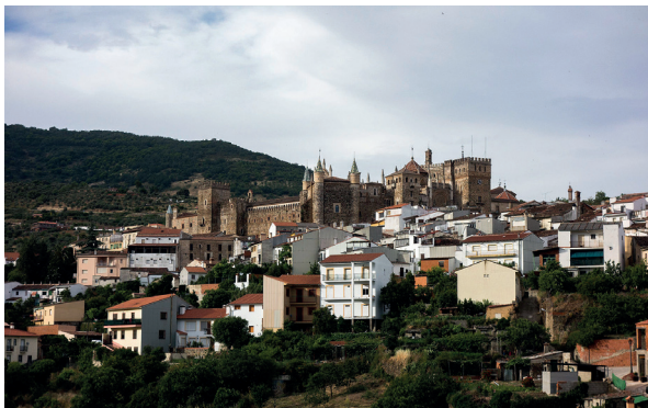
Obr. 29 Guadalupe ve Španělsku