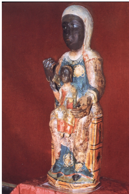
Obr. 32 Dřevěná soška Panny Marie v Guadalupe

Socha byla ale již tehdy velmi stará. Dle pověsti ji totiž vyřezal přímo apoštol svatý Lukáš. Jednalo se tedy nepochybně o velmi vzácný dar. Již když ji svatý Isidor 16 , který od papeže dostal