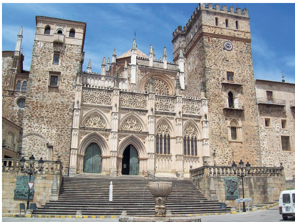
Obr. 30 Královský klášter v Guadalupe ve Španělsku