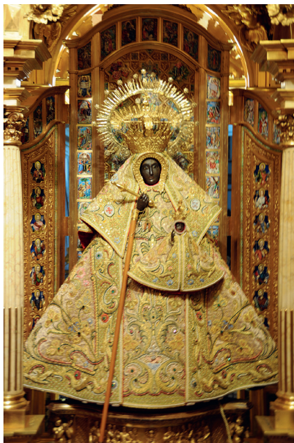
Obr. 33 Oblečená soška

tento úkol, převážel do Španělska, děly se v její přítomnosti zázraky.