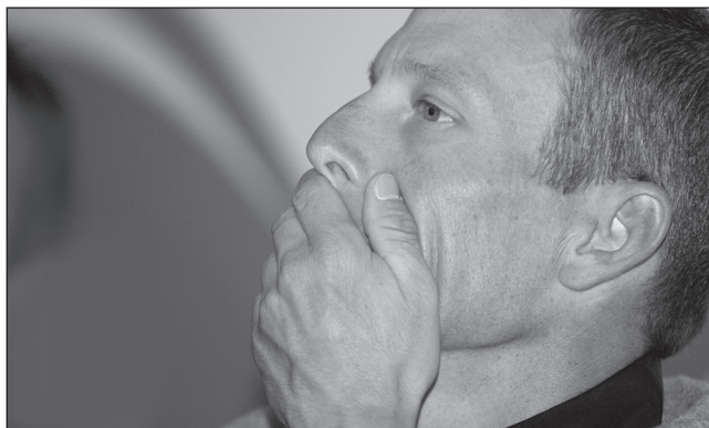
Fotografie 7-4: Na obličeji Lance Armstronga vidíme náhlé potemnění (na původní fotografii zčervenání) pleti na nose, tvářích, krku a uších ve chvílích, kdy odpovídal na otázky o svém dopingu.