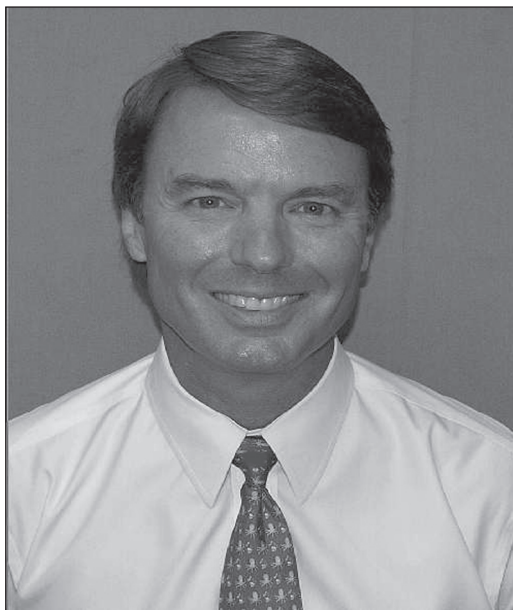
Fotografie 7-3: Bývalý senátor a kandidát na prezidenta John Edwards se červená a potí (dva příznaky lži) a dokonce usmívá na policejní fotografii.