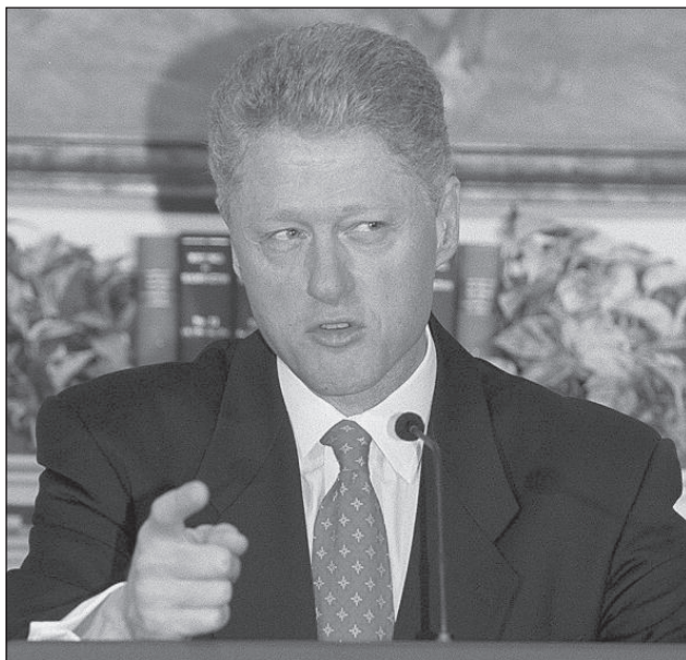
Fotografie 7-5: Prezident Clinton má nad horním rtem, na čele, tvářích a po stranách nosu viditelný pot ve chvíli, kdy americkému lidu lže o svých pletkách s Monicou Lewinskou.