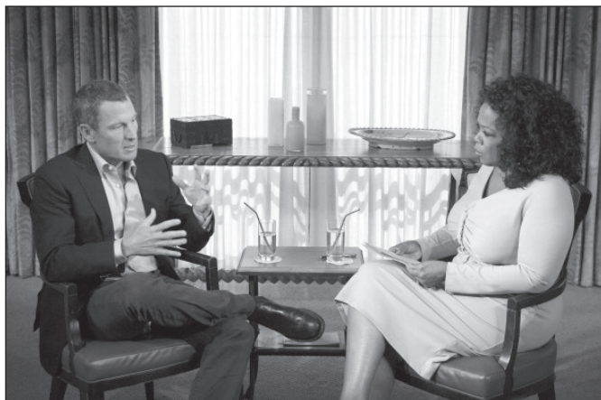
Fotografie 7-1: Lance Armstrong během interview s Oprah. Na jeho ramenou i horní části hrudníku je patrná zřejmá tenze.