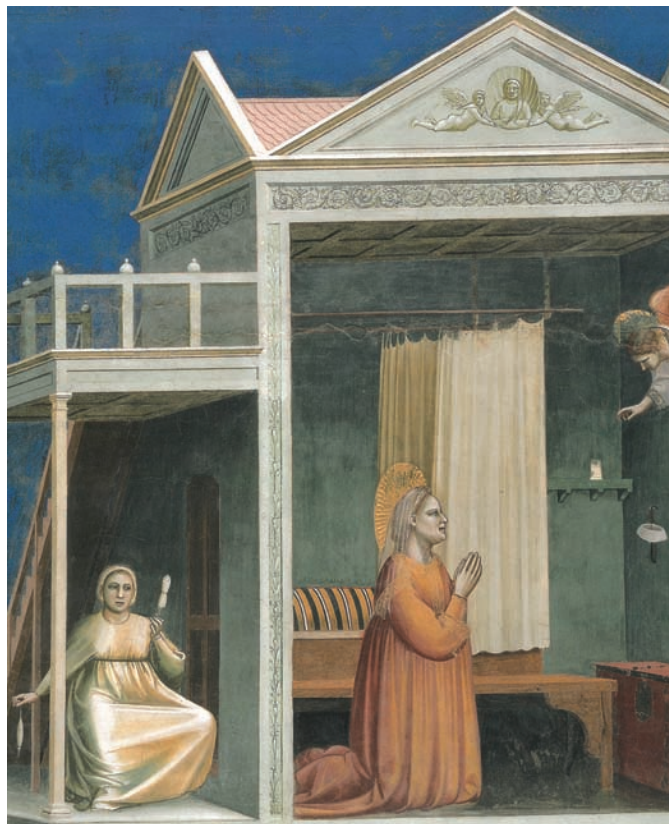
Obr. VIII/11: Freska Zvěstování sv. Anně (Giotto; Cappella Scrovegni v Padově; 1304–1305).

Fig. VIII/10: Dress with gores from Herjolfsnes in Greenland (second half of the 14th century).