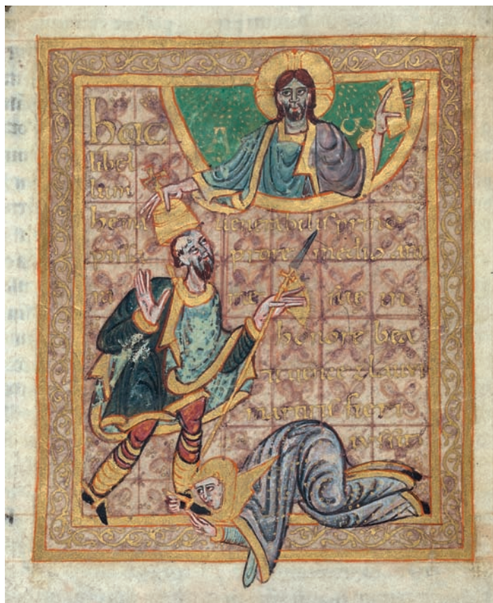
Obr. VIII/1: Kněžna Emma u nohou sv. Václava, jemuž Kristus na hlavu vkládá mučednickou korunu (Gumpoldova legenda / Gumpold: Vita Venceslai; před rokem 1006).