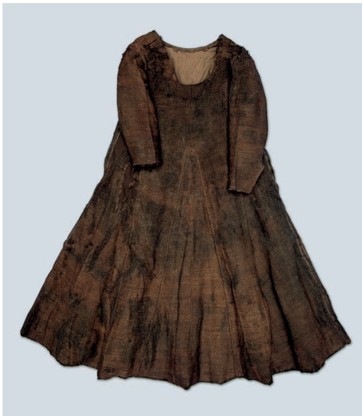
Obr. VIII/10: Šaty s klíny z Herjolfsnaes v Grónsku (2. polovina 14. století).

Fig. VIII/10: Dress with gores from Herjolfsnes in Greenland (second half of the 14th century).