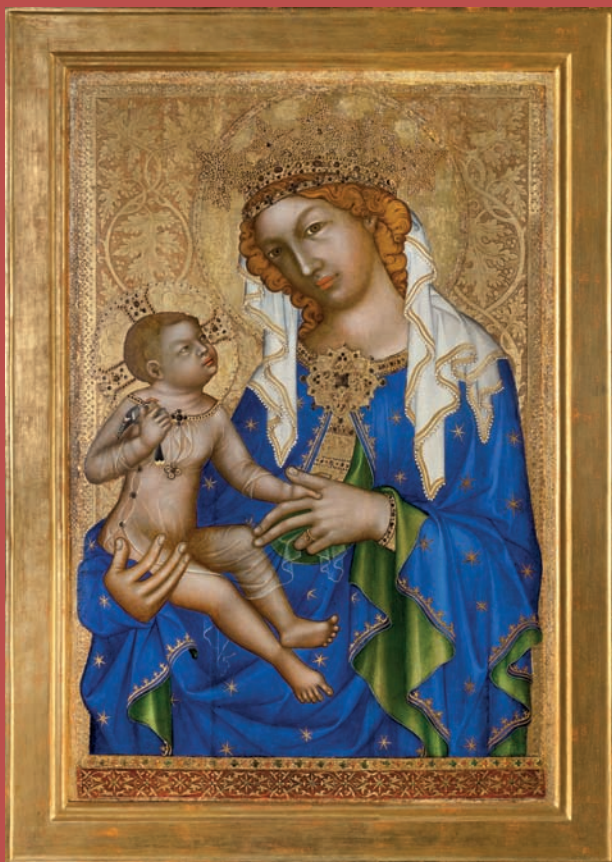
Obr. VIII/16: Madona ze Zbraslavi (Anonym; 1345–1350).