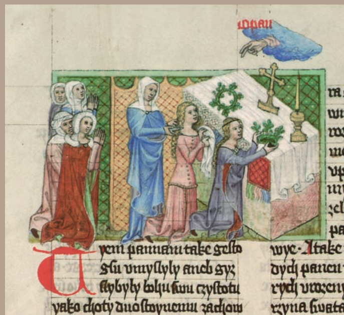
Obr. VIII/9: Klečící panny před oltářem (Sborník šesti traktátů Tomáše ze Štítného zvaný Knížky šestery o obecných věcech křesťanských; 1376).