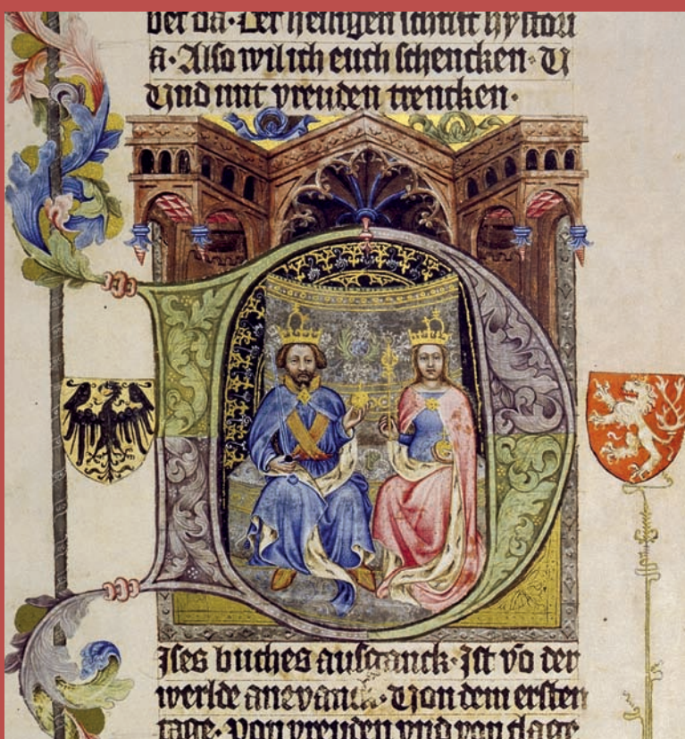
Obr. VIII/13: Král Václav IV. s manželkou Žofíí Bavorskou (Mistr Balaamovy historie; Bible Václava IV. / Wenzelsbibel; 1390–1395).