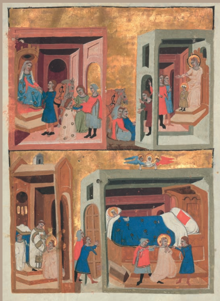
Obr. VIII/8: Sv. Ludmila se zpovídá a připravuje na smrt. Tunna a Gomon vyrážejí dveře komnaty a rdousí sv. Ludmilu (Kronika tak řečeného Dalimila – fragment latinského překladu; 1330–1340).