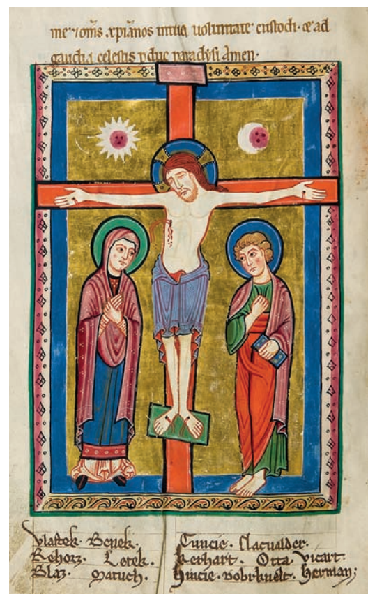
Obr. VIII/3: Ukřižování s Pannou Marií a sv. Janem Křtitelem (Ostrovský žaltář / Codex Ostroviensis; okolo roku 1174).

Oděvy, původně se vyznačující volným netvarovaným střihem, byly postupně vystříhány přiléhavějším, krejčovsky zpracovanějším šatem, který se přizpůsoboval postavě nositelů. Střih oděvů byl nadále odvozen od tuniky s vloženými klíny, od 12. století se však u něj začaly tvarovat průramky a také hlavice na horní části rukávů.