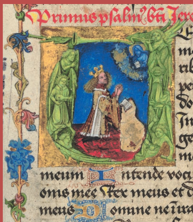
Obr. VIII/14: Král Ladislav Pohrobek při modlitbě (Modlitební knížka Ladislava Pohrobka / Orationale regis Ladislai Posthumi; 1453–1457).