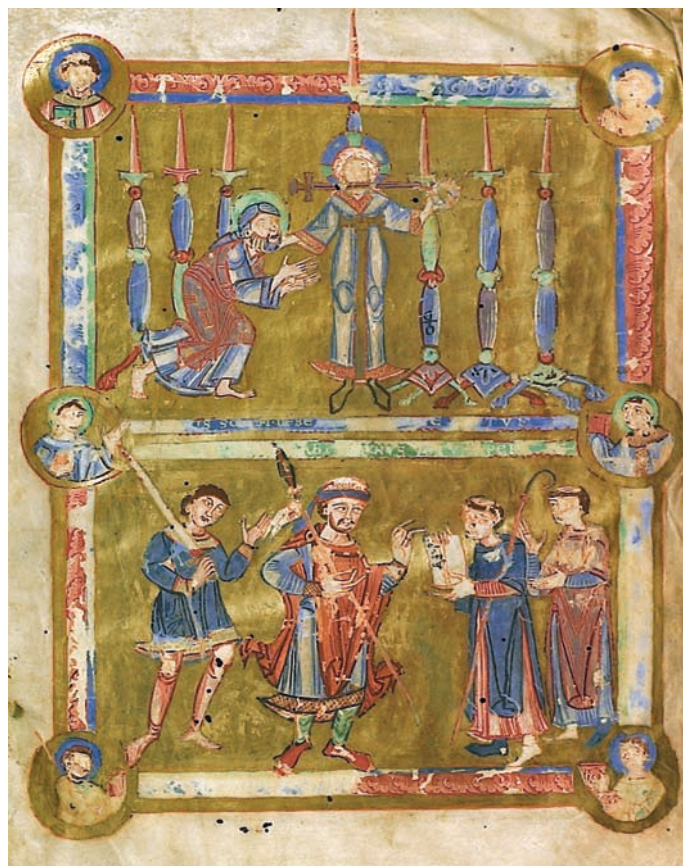
Obr. VIII/2: Iluminace k Janově Apokalypse (Zj 1, 13–17). Spytihněv II. předává novému sázavskému opatu listinu (Svatovítská apokalypsa / Apocalypsis; 1060–1061).