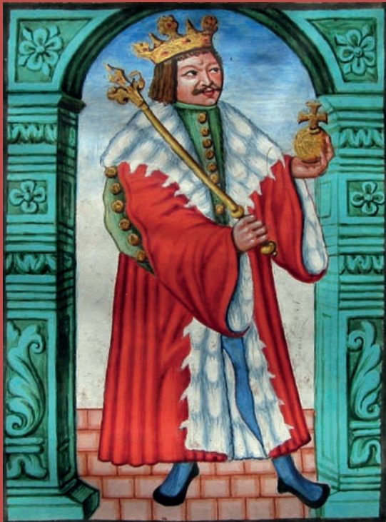
Obr. VIII/15: Král Jiří z Poděbrad (Kronika česká Přibíka Pulkavy z Radenína / Przibikonis de Radenin dicti Pulkavae chronikon Bohemiae; kopie z roku 1607 podle originálu z doby kolem roku 1530).