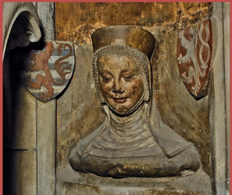
Obr. VIII/17: Královna Eliška Přemyslovna (dílna Petra Parlěře; triforium katedrály sv. Víta, Pražský hrad; 1375–1378).