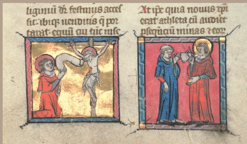
Obr. VIII/7: Sv. František před křížem z kostela sv. Damiána. Sv. František dává peníze knězi z kostela sv. Damiána (Život sv. Františka / Vita sancti Francisci; okolo roku 1300).