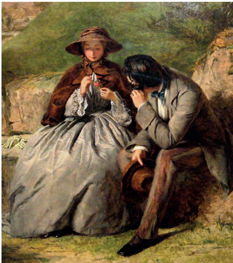
A chodit i žít se mnou byste nechtěla? Tak se asi táží oba svůdci: nahoře dvoříci se mladík na obraze Williama Powella Frithe (1855), dole dvorný a zkušený muž namalovaný Nikolajem Dmitrijevičem Kuzněcovem (1885). Art Institute of Chicago, Wikimedia Commons, public domain

byla „u Kafrů žena nižší třídy a ošklivá za osm volů, kdežto za dceru náčelníka, velice krásnou, zaplatil manžel čtyřicet volů. Prodej se stal po podrobné prohlídce ze strany rodičů manželových. Obě strany smlouvaly právě s takovou úporností, s jakou v našich civilisovaných krajích sedlák kupuje koně nebo velice praktický otec vyjednává výši věna. Někdy byla žena koupěna na úvěr,“ stojí v antikvární D’Almérasově knížečce Manželství u různých národů (1908). 358