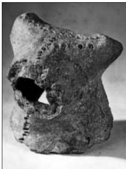
Hlavička zoomorfní nádoby z Libice nad Cidlinou. 10. století.

AQUAMANILE – obřadní nádoba užívaná při křesťanské bohoslužbě, přeneseně též označení pro jakoukoli raně středověkou zoomorfní nádobu. Nádoby obvykle zoomorfních tvarů sloužily ve vrcholném středověku k obřadnímu mytí rukou při mši. V raném středověku není sice na našem území používání zoomorfních nádob k tomuto účelu přímo doloženo, termín aquamanile je ovšem používán jako obecné označení poměrně vzácných nálezů zoomorfních keramických nádobek či jejich fragmentů. Jde o ojedinělé nálezy, jejichž účel není zcela zřejmý; snad jen objev zlomku výlevky v podobě býčí hlavičky při kostelní stavbě v Libici nad Cidlinou