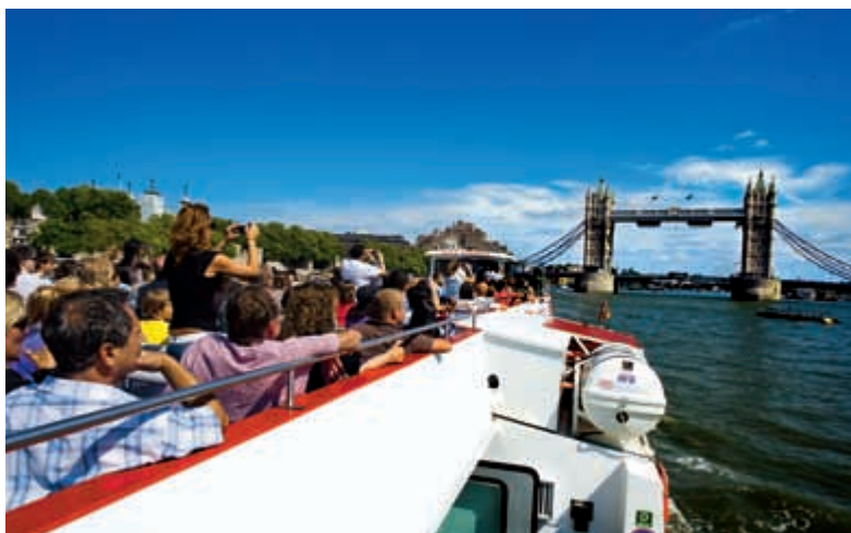
Lod s výletníky se blíží k Tower Bridge.

Projet se za slunného dne lodí po Temži je příjemný způsob, jak si uvědomit, že řeka byla páteří města. Můžete se vydat na krátkou plavbu městem od mola ve Westminsteru po proudu podél City of Westminster a City of London nebo na delší vyjížďku proti proudu venkovskou oblastí stále zelenějšími oblastmi vnějšího Londýna.