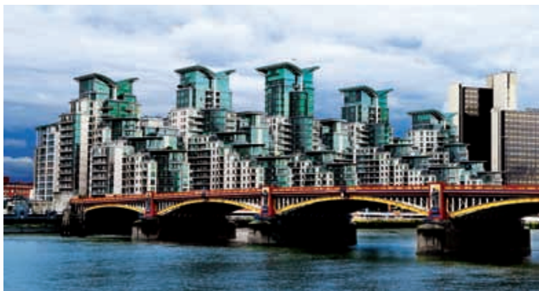
Vauxhall Bridge je jedním ze 34 mostů přes Temži.