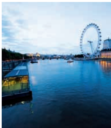
Pohled k jižnímu břehu Temže za soumraku