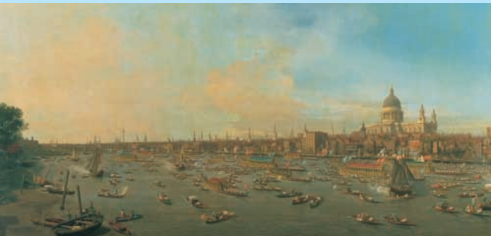
„Temže v Den primátora“, okolo r. 1747, od Giovannioho Antonia Canaletta

Ačkoliv byl Londýn kdysi největším přístavem na světě, dnes jeho vody nebrzdí žádné nákladní lodě. Ty, které plují po Temži v současnosti, ať již kvůli zábavě či přepravě, lze jen stěží přirovnat k lodím z minulosti, kdy většina britského bohatství připlouvala a odplouvala po řece.