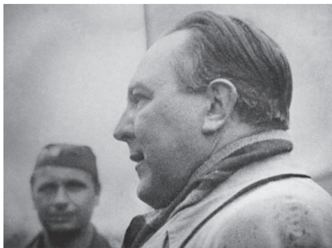
Vítězslav Nezval v Těchoníně

OD 26/5 bylo v Bedřichově u Jihlavy (dnes část Jihlavy) zřízeno sběrné středisko pro Němce. Středisko se nacházelo po obou stranách silnice z Jihlavy do Prahy a bylo rozděleno na čtyři samostatné tábory, označené A1, A2, B (ten fungoval jako táborová nemocnice) a C. Celková kapacita byla 800 osob. Tábor spravoval Místní národní výbor Bedřichov, od 27. srpna do 31. prosince vyšetřovací komise Okresního národního výboru Havlíčkův Brod a od 1. ledna 1946 přímo Okresní národní výbor Havlíčkův Brod. Velitelem střediska byl Josef Sojka. Ve stejný den byl uveden do provozu další jihlavský tábor v Horním Kosově (dnes část Jihlavy). Internované střežili na počátku existence tábora vojáci Rudé armády, které během léta vystřídali českoslovenští vojáci.