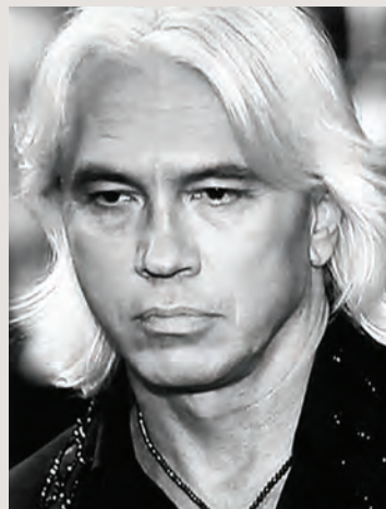
Dmitrij Chvorostovskij