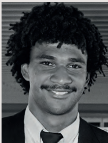
Rud Gullit