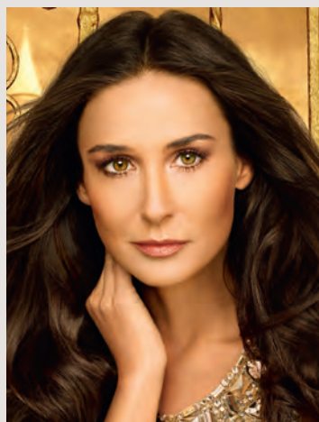
Demi Moore