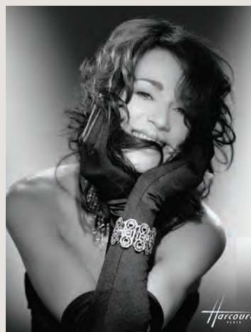
Maruschka Detmers