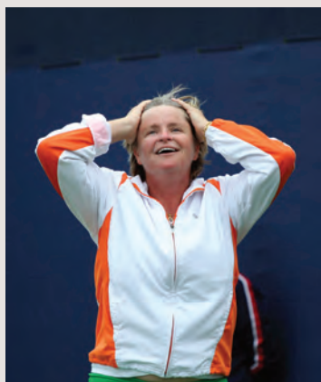
Hana Mandlíková

27. července 4. srpna 19. září 22. října 23. listopadu 26. listopadu 16. prosince