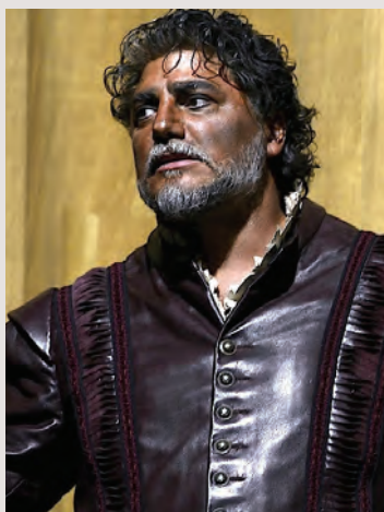
José Cura