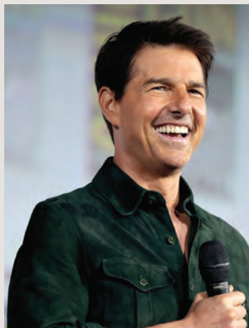
Tom Cruise