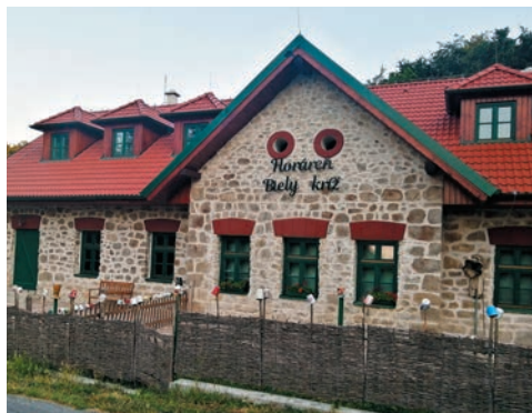
Lúka a horáreň na Bielom kríži

Ide o označenie historického objektu horárne v lesoch Malých Karpát v katastrálnom území obce Svätý Jur. Na tomto mieste nájdeme budovy horárne (nespoliehajme sa však na to, že sa v nich ubytujeme) a kresťanské symboly – biely kríž a sošku Panny Márie. Od bratislavskej mestskej časti Rača je toto miesto vzdialené takmer 5 kilometrov. Kúsok od Bieleho kríža sa nachádza vrch Sakrakopec, kde v roku 1966 padlo lietadlo bulharských aerolínií, pričom zahynulo všetkých 82 ľudí na palube. K miestu nešťastia nás z Bieleho kríža nasmeruje ukazovateľ.