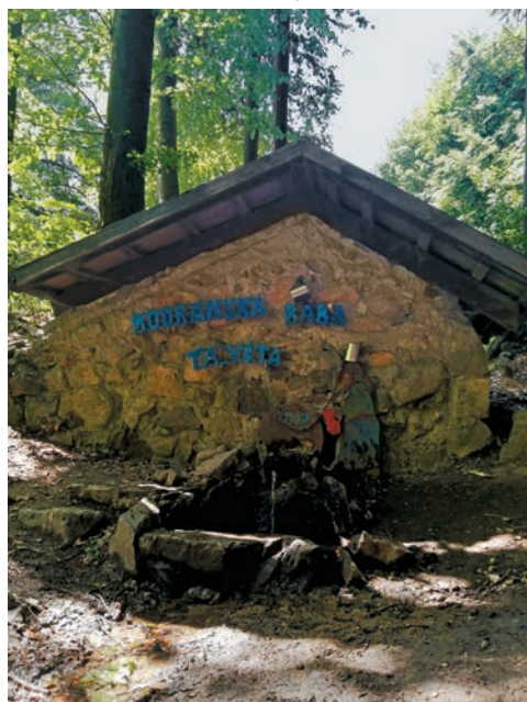
Prameň pod Čermákovou lúkou

značke zísť na Zochovu chatu alebo sa aspoň občerstviť v chate Pod lesom. My sme tak urobili a nabrali sme si tiež v neďalekom