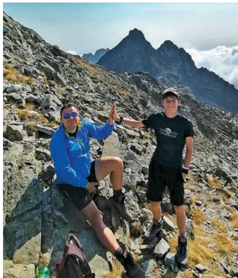
Dlhé roky na hory chodím práve s otcom

Paradoxom je, že pri balení zistíte, že to, čo si zbalíte napríklad na nejaký trojdňový prechod, vám bude stačiť aj na mesačný výlet. Dve tričká, maximálne tri. Nohavice, dlhé i krátke, s tým že výhoda je ich mať spojitelné. Dva, možno tri páry ponožiek, čelovka, toaletný papier, power banky na mobil (ak ste rovnako ako ja vášnivý dokumentarista svojich ciest), lekárníčku, ktorá bude obsahovať nevyhnutné lieky – paralen, ibalgin či niečo na žalúdok a proti bolesti. Fajn sú