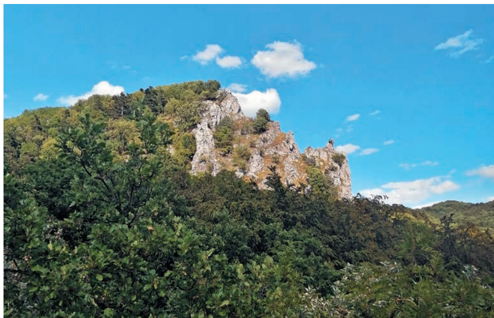
Vápenná zo Sološnice

musíme vyjsť až do výšky 752 metrov), avšak v priaznivom počasi nás Vápenná odmení krásnymi výhľadmi.