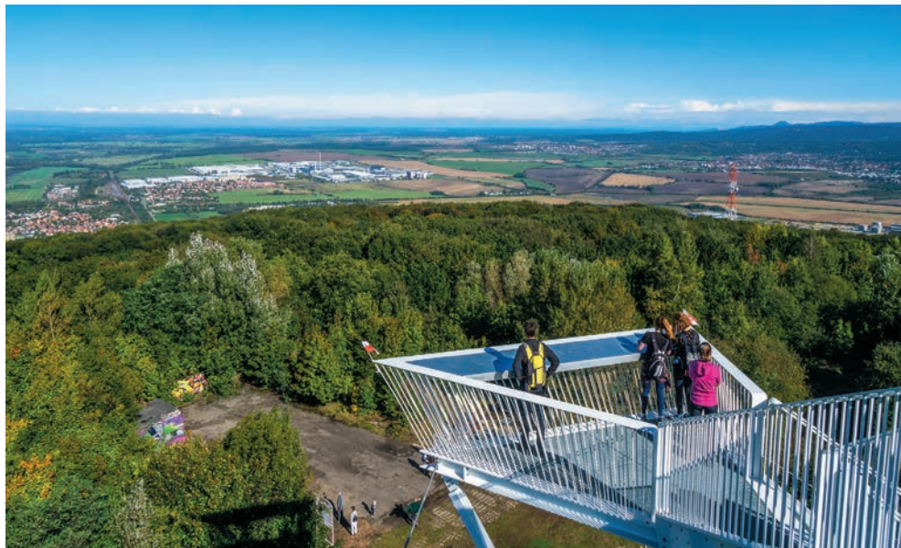
Rozhľadňa na Devínskej Kobyle

konci sídliska Kútiky. Červené značky nás privedú ku schodom, ktoré sa zvažujú do záveru Líščieho údolia. Nájdem tu rekreačný