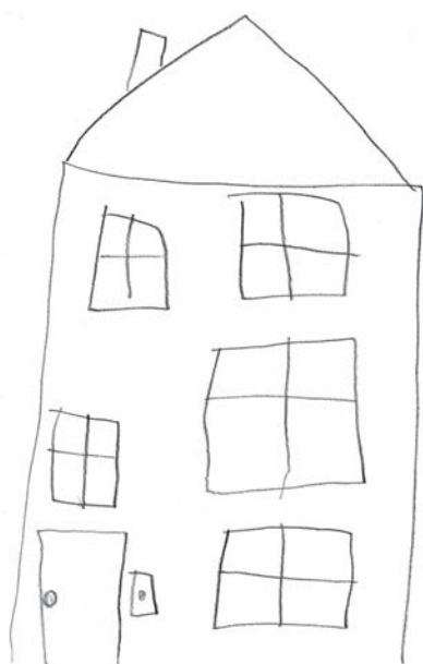
Chlapec; 6 roků, 5 měsíců

Ve spontánní kresbě dítěte se objevují určité tvary, grafomotorické prvky, jejichž různorodost a náročnost přibývá s věkem. Zpočátku jsou to pouze čáry a kruhy, navazující na prvotní čáranice a motanice, postupně se zvyšují dovednosti dítěte a přibývají prvky daleko složitější a náročnější. U grafomotorických prvků můžeme zpravidla dobře posoudit i formální provedení kresby. Při vyhodnocení školní zralosti je vhodné sledovat kreslení zubů a řadu horních smyček (popř. můžeme přidat horní oblouk s vratným tahem).