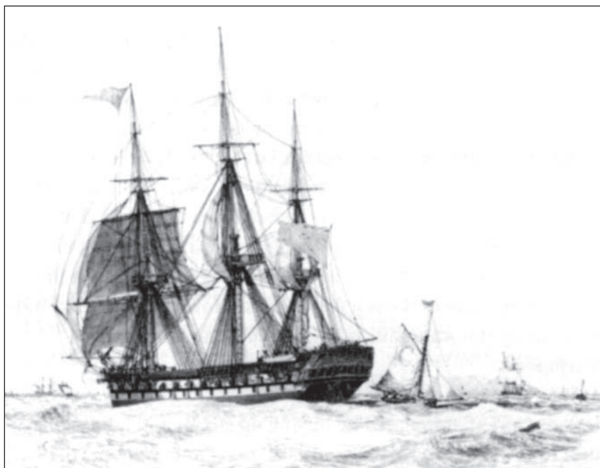
Lod' East Indiaman, 1829

Prirodzene, že tu existovala konkurencia, ale bola to medzinárodná konkurencia, v Indii medzi Angličanmi, Holanďanmi a Portugalcami, a v rámci každej krajiny bola eliminovaná do takej miery, ako to len bolo možné. Do obchodu sa stále pokúšali preniknúť nováčikovia, a tak jedným z kľúčových privilégii, ktoré štát udelil Východoindickej spoločnosti, bolo právo na zásah proti „votrelcom“.