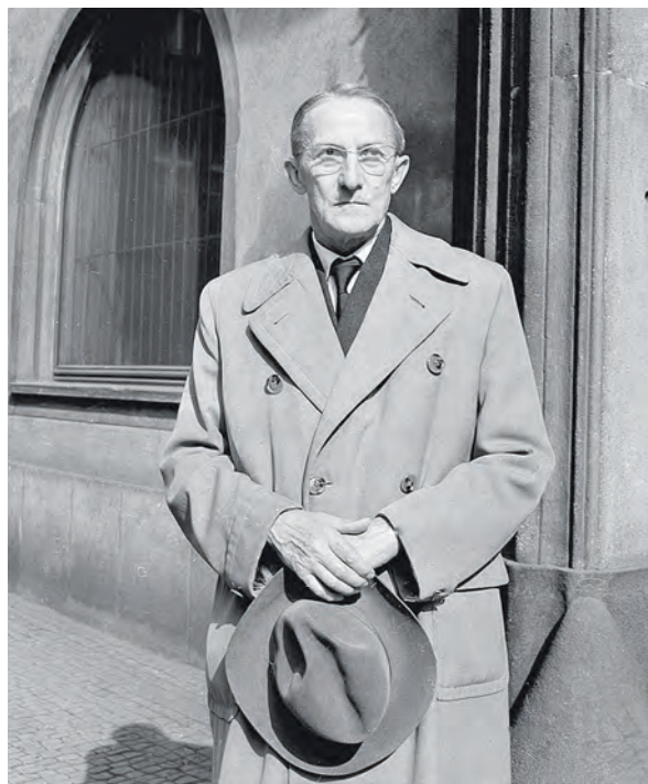
Obr. 84 Jaroslav Heyrovský na snímku z 16. března 1961