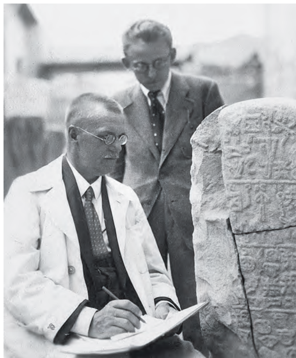
Obr. 81 Bedřich Hrozný na vykopávkách