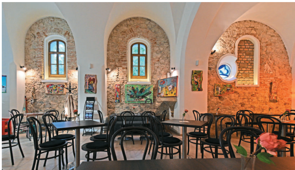
Interiér kostola po prestavbe na kaviareň