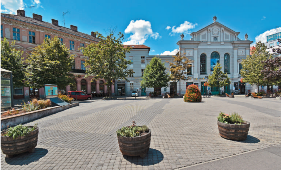
Priestor pred Starou tržnicou s vyznačeným pôdorysom kostola