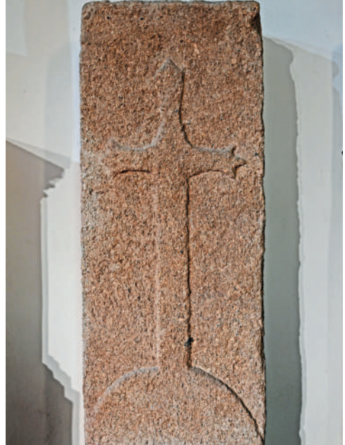
Náhrobný kameň v klariskom kostole

sv. Martina. V priebehu 15. storočia, zrejme medzi rokmi 1436 až 1473, sa realizovala rozsiahla prestavba chrámu. V roku 1473 sa kostol spomína ako trojloďová stavba s desiatimi oltármi a tromi zvonmi vo veži. Podoba východnej svätyne nie je známa, môžeme však predpokladať, že mala podobný polygonálny pôdorys ako pri Dóme sv. Martina.