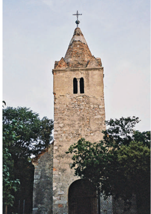
Stav kostola v roku 2005

Dovtedy sa reálne uvažovalo o stredovekom, resp. románskom pôvode zachovanej stavby. Odborníkov k tomu viedla podoba kostola, rozšírená v románskom a ranogotickom období – jednolodie s kvadratickou svätyňou a jeho orientácia viac-menej na východ, starobylé patrocínium sv. Víta a tiež združené okná na veži so stredovými stĺpkami, ktoré predstavujú typický stavebný prvok románskeho obdobia. Majú bobulové