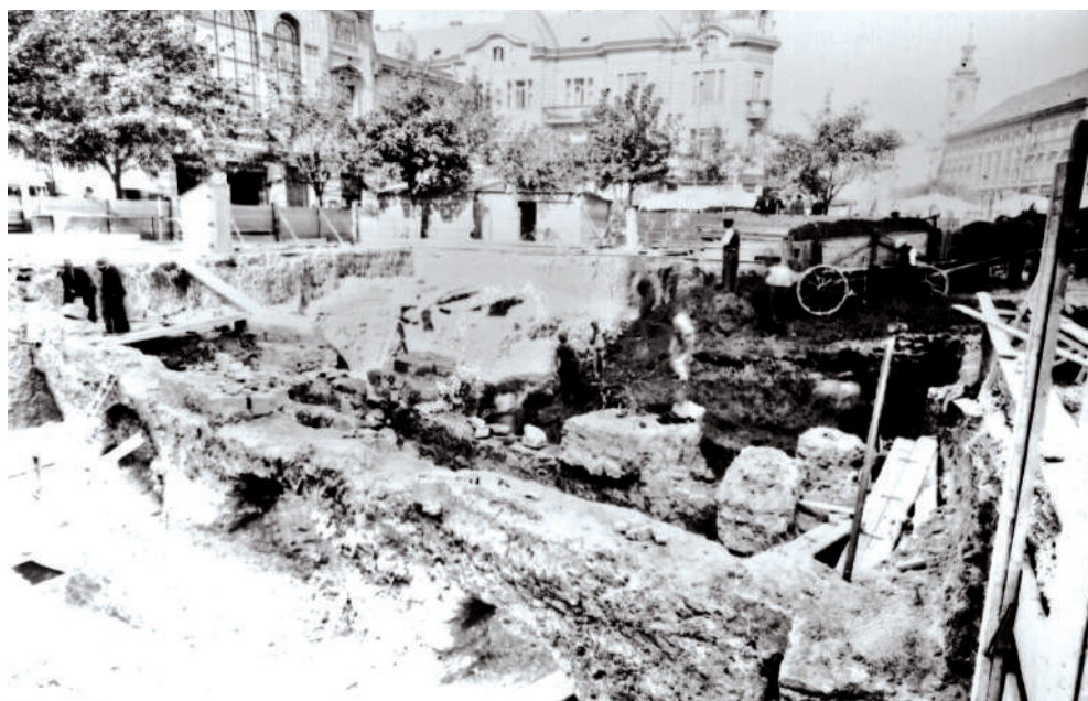
Pohľad na odkryté zvyšky kostola v roku 1935

Z vybavenia chrámu sa liturgické náčinie a ďalšie zariadenie preniesli do kostolov za hradbami. Časť vybavenia mala byť predaná a z výnosu sa mali financovať práce na mestskom opevnení, časť sa však v nepokojných časoch aj stratila. Kostolné zvony boli roztažené na výrobu diel, tomuto osudu sa vyhol len tzv. umieračik, ktorý umiestnili na vežu Starej radnice. Zvon vyrobený v 15. storočí v dielni majstra Veita Maussera sa dnes nachádza v zbierkach Múzea mesta Bratislavy.