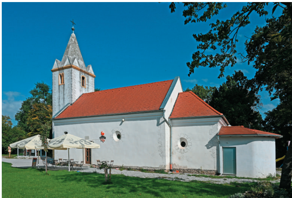
Podoba bývalého kostola v roku 2021

Stalo sa tak v roku 1613, ako o tom hovorí text kamennej tabule osadenej nad