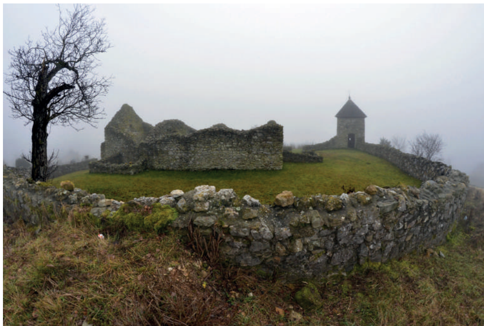
Stredoveký Kostol Narodenia Panny Márie v Lúčke

Časť už nepotrebných či opustených kostolov zachránila v minulosti pred zánikom