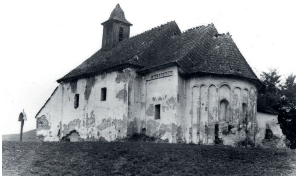
Kostol v Petrovciach v tridsiatych rokoch 20. storočia

zmena ich využitia. Z Božích chrámov sa tak stali sýpky, sklady či dokonca aj súkromné obydlia. Tento proces v podstate pokračuje aj v súčasnosti, avšak vo väčšine prípadov predsa len v prijateľnejšej podobe, keď sa funkčne menia na múzeá či koncertné a výstavné sály.