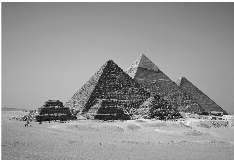
Symbolom starovekého Egypta sú pyramídy v Gíze.

dejín rôznymi obdobiami vzostupov a pádov, a dokonca viacerými kolapsmi. 2