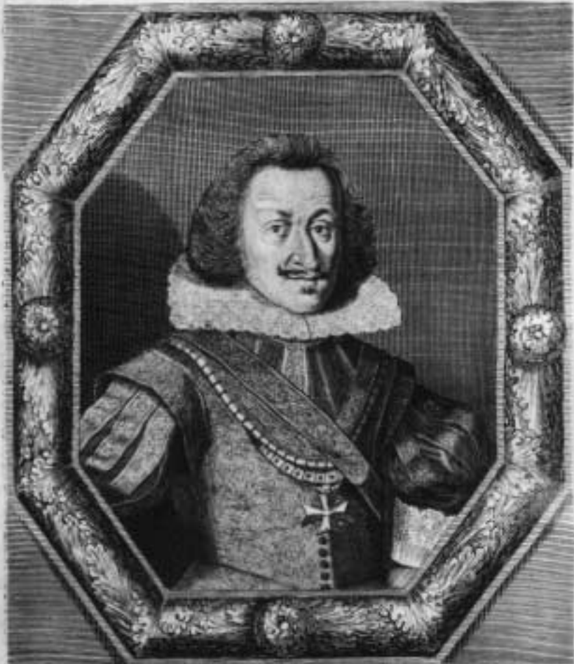
DON BALTASAR MARADA SE VIC. CONTE DEL S R I COMMENDATORE DELL' ORDINE DI MALTA CASTELLANO D'AMPOSTA GENT' DELLA CAMERA DI S M CES' CONS' DI STATO TENENTE GENERALE GENERALE DI BOEMIA CAP' DELLA GUARDIA D'ARCIERI DEL SUPREMO CONS' DI GUERRA DI S. M. CATT' SUO COLONELLO STIPENDIATO &.