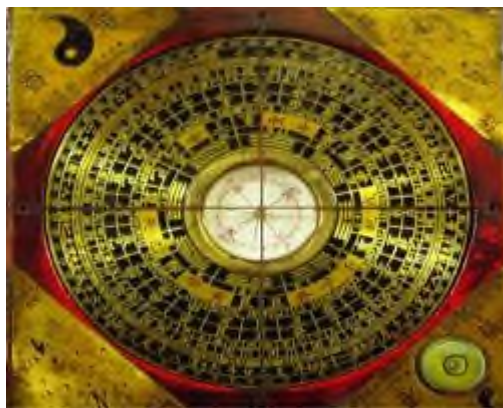
Kompas poradce Feng Shui

Naleznete zde univerzální typy, které lze okamžitě použít. Pokud však chcete svůj byt nebo kancelář zharmonizovat opravdu kvalitně, doporučuji vám vyhledat zkušeného poradce Feng Shui, který provede analýzu vašeho prostoru na místě a při- způsobí své rady vaší osobnosti a členům vaší rodiny nebo týmu. Pravděpodobně také použije kombinaci více metod, pro získání hlubší analýzy.