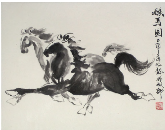
Kůň – symbol úspěchu

Další pověst se týká magického čtverce Lo-šu. Tento dodnes používaný čtverec byl údajně spatřen na zádech černé želvy, jenž se vynořila z vln Žluté řeky. Kapky vody, které ulpěly na jejím krunýři vytvořily čísla magického čtverce a staly se tak základem čínské numerologie.