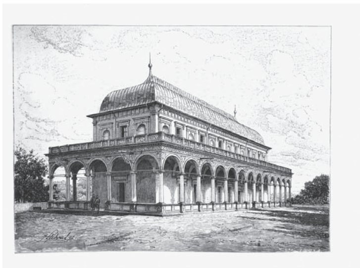
Ojedinělá krása Královského letohrádku prochází epochami

A kdo je – přirozeně vedle samotného stavebníka Ferdinanda – pod stavbou podepsán? Nad tím se stále vznášejí otazníky. U počátku stavby nacházíme italského stavitele Giovanniho