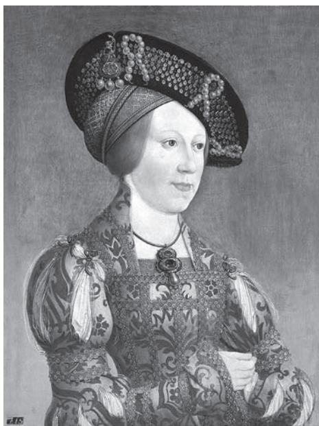
Hans Maler zu Schwaz: Anna Jagellonská, královna česká a uherská (1519)

Kromě toho byl jeden z reliéfů na Královském letohrádku dříve interpretován jako předávání dobudované stavby Ferdi-