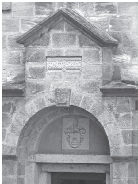
Detail hrobky Schüttelsbergů v Nebřenicích