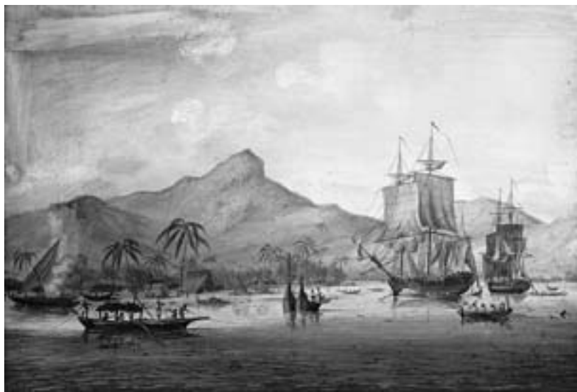
Lodě „Resolution“ a „Endeavour“ v zálivu ostrova Huahine (Společenské ostrovy, Polynésie) za Cookovy třetí plavby v letech 1777–1779. Kvaš Johna Clevelyho, květen 1787.

mu podařilo dokázat, že nejsou součástí hledaného světadílu, a když proplul Torresovým průlivem, ukázalo se i to, že Nové Holandsko a Nová Guinea nejsou spolu spojeny. Když se v roce 1771 vrátil, zdolal bez jediné oběti kurdějí a s jedinou lodí asi pět tisíc kilometrů pobřeží a zmapoval je. Plul s ním také botanik a přírodovědec Joseph Banks, který si dělal vlastní zápisky o plavbě. Ty pak byly spolu s Cookovými deníky předány Johnu Hawkesworthovi, jenž v roce 1773 předložil třísvazkový přehled o plavbách v Pacifiku od Byronovy výpravy. V něm ke Cookovu hněvu provedl bez jakýchkoli mořeplaveckých znalostí změny, vložil své myšlenky a přikládal Banksově zprávě až příliš velký význam, a proto Cook napříště vzal vydávání výsledků svých cest do vlastních rukou.