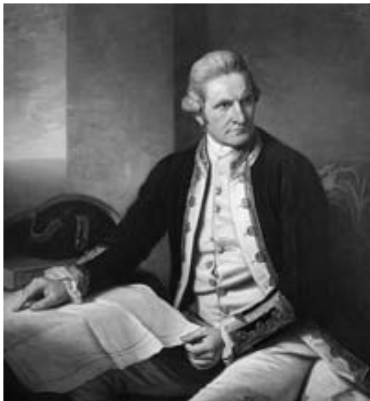
Portrét Jamese Cooka před jeho poslední plavbou (Nathaniel Dance, 1776).

umožnily moderní představu o světě a vyplnily četné mezery po portugalských, nizozemských, britských a francouzských objevitelích. Cook začal svou kariéru za britsko-francouzské války v Kanadě a v letech 1763 až 1767 mapoval Newfoundland, poté ho roku 1768 britská Admiralita pověřila výzkumnou plavbou do Pacifiku, jež měla sloužit přesnému pozorování geografických poměrů, flóry a fauny. Jeho loď Endeavour , solidně stavěná a zvláště vhodná pro delší plavby, byla vybavena všemožnými novinkami, například destilačním přístrojem pro výrobu pitné vody, ale i prostředky proti kurdějím.