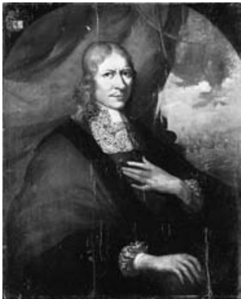
Portrét Rijklofa van Goense (připisovaný Martinu Palinovi, 1680–1700). Van Goens byl v letech 1648 až 1654 několikrát vyslancem Nizozemské východoindické společnosti u mataramského sultanátu na Jávě, v letech 1659 a 1672 několikrát guvernérem Cejlonu a v letech 1678–1681 generálním guvernérem v Batávii.

ze svých mužů v Bantenu. Do roku 1611 vyplulo nejméně osm dalších anglických flotil.