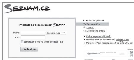
Obrázek 2.1: Registrace účtu Seznam

Vzhled stránky a umístění odkazů se může v čase měnit, nicméně podstata postupu bude pravděpodobně i v budoucnu zachována. V případě, že vzhled stránky již neodpovídá vzhledu uvedenému v této knize, upravte postup podle aktuálního rozložení stránky.