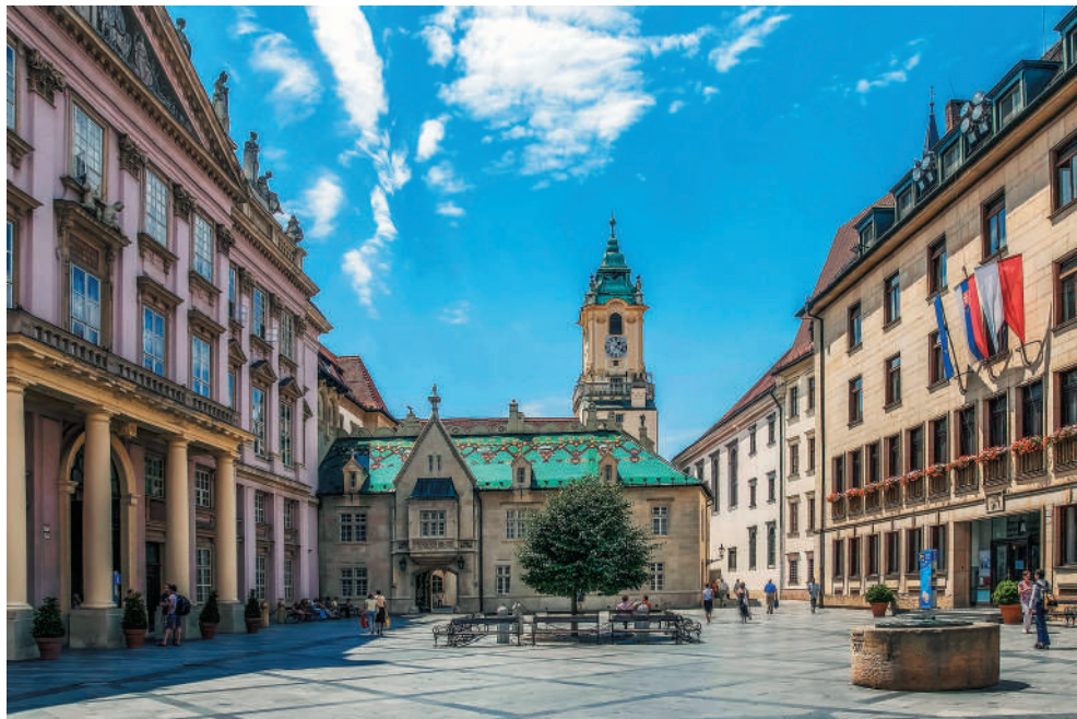
Primaciálne námestie v Bratislave

témy vo vyhľadávачoch. Na Slovensku sme sa nenačili dosiaľ ťažiť z filmu po jeho nakrútení a neexistujú na to ani žiadne zásadné nástroje či príklady vhodné na inšpiráciu. Len niekoľko výnimiek v podobe múzeí či konkrétnych lokalít sa otvorene priznáva ku vzťahu k filmu, kým inde môže byť film považovaný za invazívny prvok.