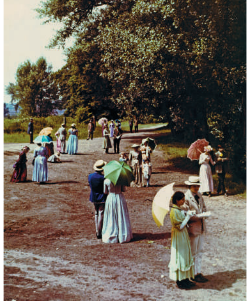
Záber z filmu Sladké hry minulého leta