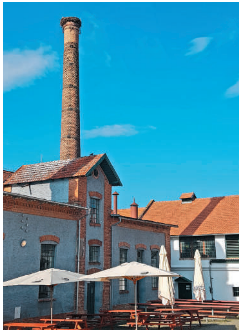
Pivovar v Dalešiciach

vodiči, pomocníci, stavitelia kulís a uplatnenie nájdú aj historické remeslá, zberatelia veteránov, šermiari atď.