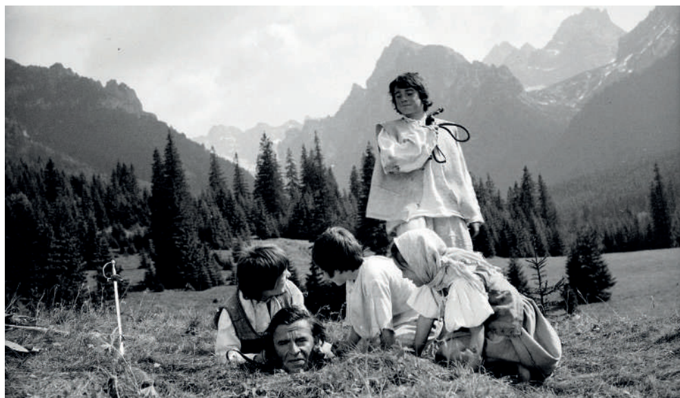
Záber z filmu Pacho, hybský zbojník

U našich českých susedov je možné vnímať spájanie českej kinematografie s konkrétnymi miestami a ich návštevnosťou o niečo intenzívnejšie než u nás. Svedčia o tom niektoré filmové skupiny na facebooku. Také filmy sú totiž jedinou pamiatkou na starých rodičov v záberoch, kým dnes si video a fotografie urobí ktokoľvek takmer neobmedzene. Ak sa však vrátíme k tvorbe Juraja Jakubiska, v Bystrickej doline sa tiež nakrúcal pre miestnych významnejší film Sedím na konári a je mi dobre (1989, pozri str. 100). Nakrúcali ho v širšom okolí