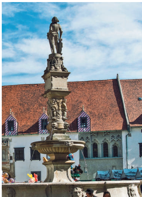
Maximiliánova fontána v Bratislave

Predkladaná publikácia Filmové miesta nie je absolútnym prehľadom kinematografie vo vzťahu k Slovensku. Obsahuje vybrané diela a vybrané miesta, ktoré sú v rôznej miere vo vzťahu k filmu či osobnostiam filmu. Zahŕňa rovnako tak lokality, ktoré sa kinematografii podarilo zviditeľniť, prípadne vytvorila cieľové miesto pre nadšencov filmu. Kniha vychádza v značnej miere z osobných skúseností autora, čiastočne vďaka profesii v cestovnom ruchu, a v spolupráci s množstvom priateľov a informátorov z prostredia cestovného ruchu, filmu, komparzu, alebo len danej lokality na Slovensku či v zahraničí. Akékoľvek nepresnosti môžu byť spôsobené nepresnými zdrojmi, nejasným označením ulíc, odstupom času a vekom informátorov, prípadne aj vlastnou nepozornosťou. Autor verí, že len minimálnou.