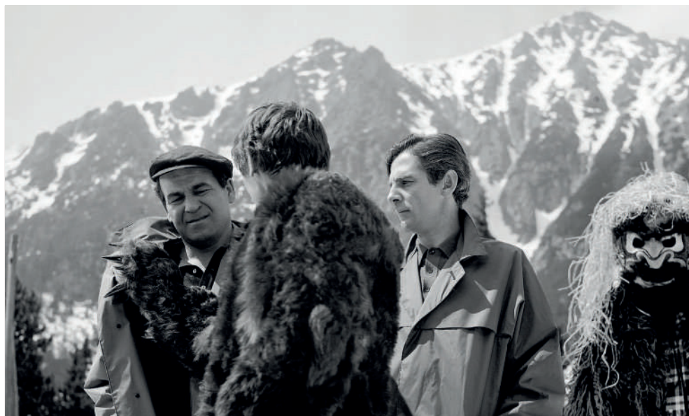
Záber z filmu Orlie pierko