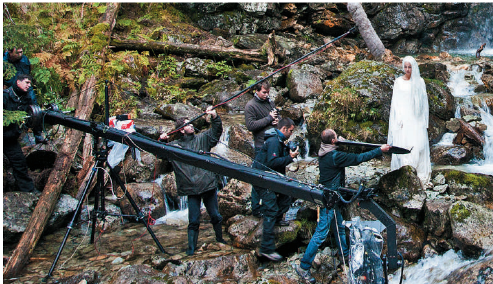
Nakrúcanie rozprávky Orest z rodu čarodejníkov

Markíza v nich nakrúca mnoho svojich seriálov, okrem čisto exteriérovej Hornej Dolnej. Tak, ako je zvykom pri „sitcomoch“ v USA a pri mnohých seriáloch aj u nás (Panelák, Hod svišťom, Profesionáli...), aj Búrlivé víno vzniká v jednej veľkej hale v Ateliéroch NAD. Všetky miestnosti u Roznerovcov, Dolinských, z nemocnice či z bytov ďalších postáv sú natesno vedľa seba oddelené len jednoduchou priechodkou. V ateliéroch prebieha výrazná recyklácia stien a rôznych prvkov. Niekedy stačí uhol jednej miestnosti, iný obraz na stene a máte novú nemocničnú izbu. Miestnosti nemajú štyri steny (zväčša len dve), kým z opačnej strany ide o scénu interiéru celkom inej scény, či dokonca iného seriálu. Technika sa tak prenáša minimálne, hercom zostáva po dlhých mesiacoch jedna šatňa a réžia má celé produkčné štúdio neustále pár metrov od kamery. Práca má jasný plán, neobmedzujú ju zmeny počasia a denné scény sa môžu pokojne nakrúcať o jednej ráno.