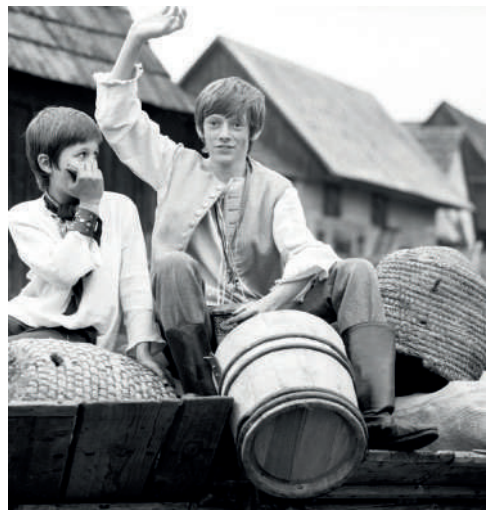
Záber z filmu Tisícročná včela

Nakrúcanie filmu bývalo pre dotknuté obce zväčša významnou udalosťou. Niektoré spolu s obyvateľmi uvádzajú tento fakt medzi svoje hlavné zaujímavosti aj takmer po polstoročí. Napr. obec Zábiedovo