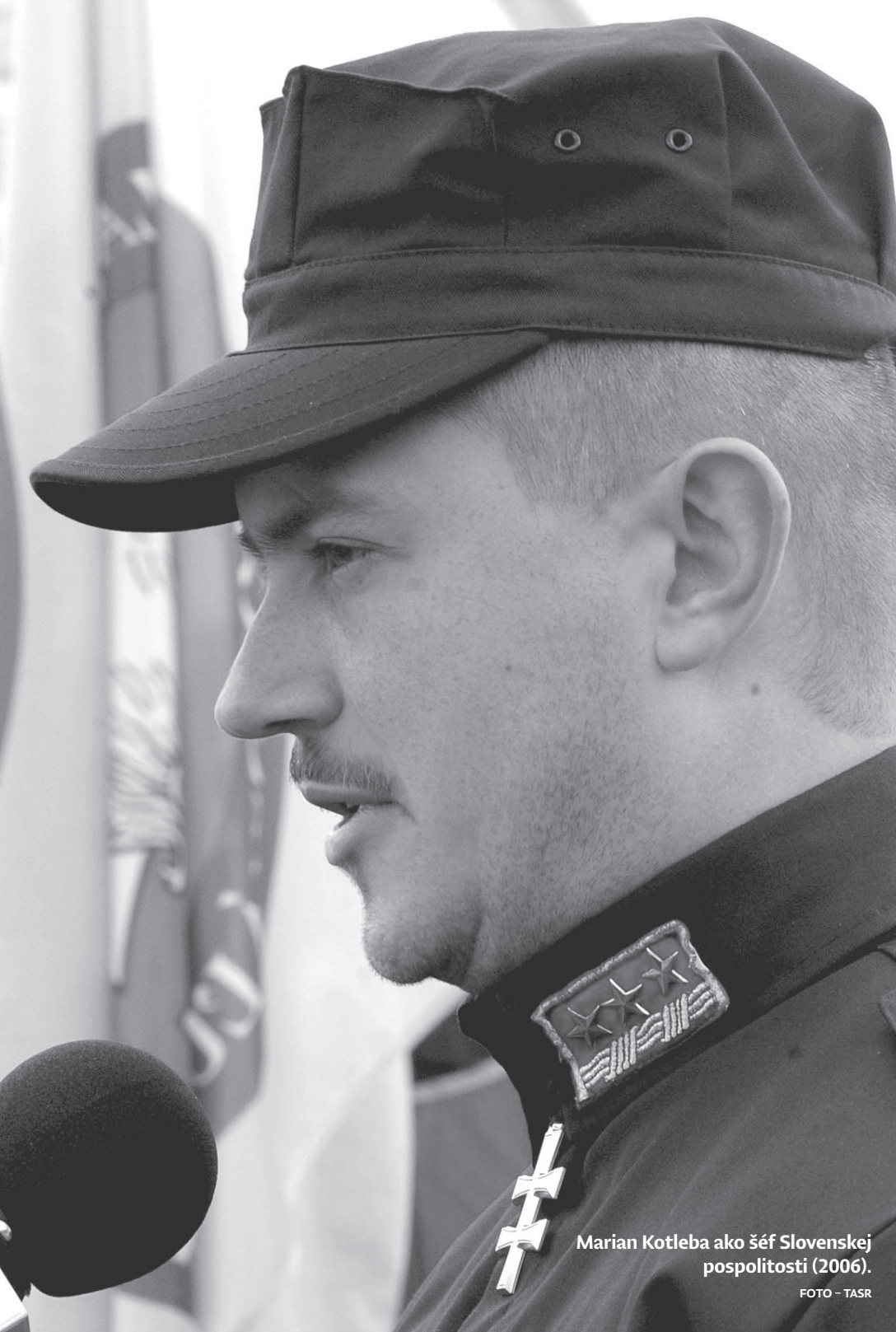
Marian Kotleba ako šéf Slovenskej pospolitosti (2006).