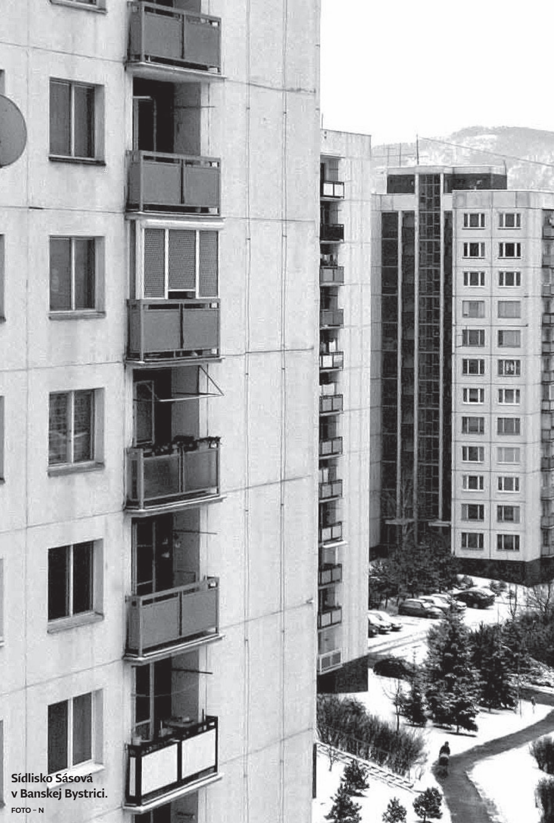
Sídlisko Sásová v Banskej Bystrici.