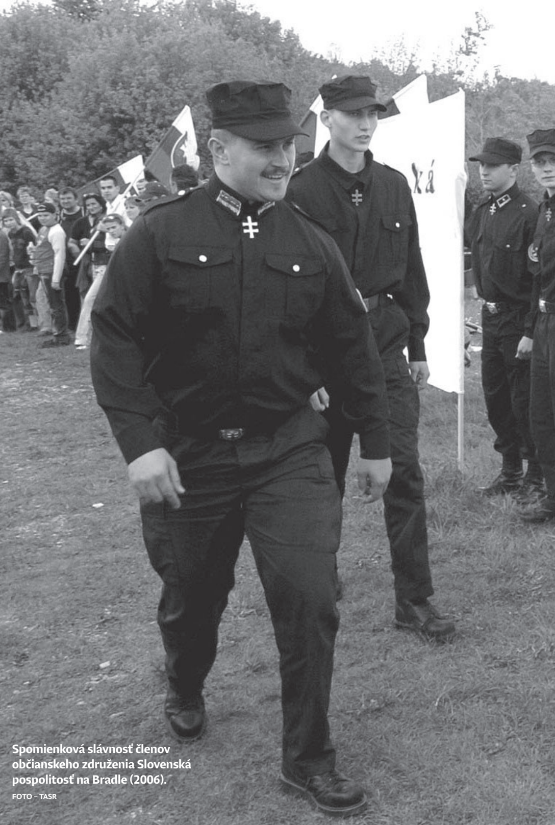
Spomienková slávnosť členov občianskeho združenia Slovenská pospolitosť na Bradle (2006).