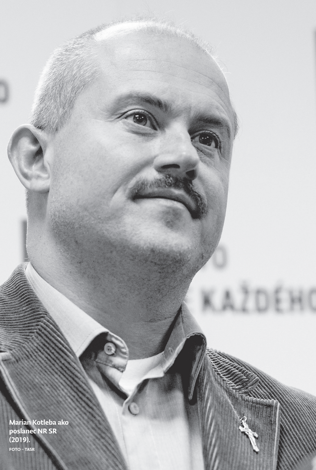
Marian Kotleba ako poslanec NR SR (2019).