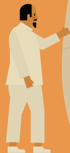
PAUL MAXIMILIEN LANDOWSKI