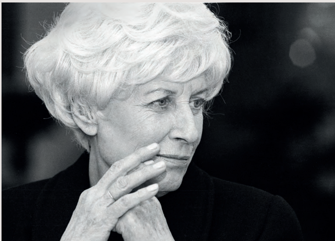
Olga Havlová se narodila v roce Kohouta

Pokud jde o zdraví, drobným problémům Kohouti neuniknou, ty závažnější se jim spíše vyhýbají. Pozor by si měli dávat především na trávení. Jsou vybíraví, měli by se však vyhýbat přejídání a nezdravým pokrmům. Na zažívání mohou mít vliv i výkyvy nálad, kterým často podléhají.