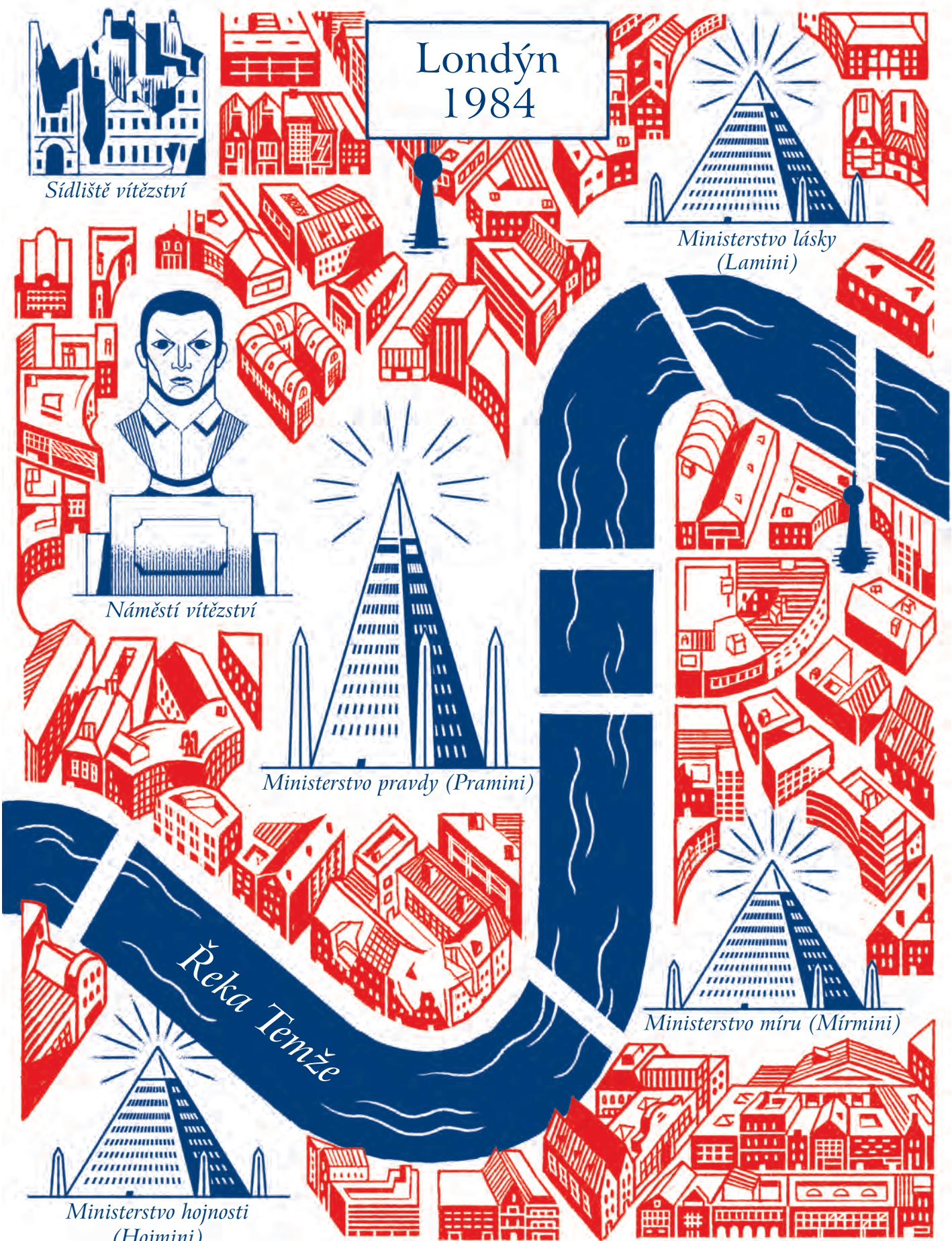
Ministerstvo hojnosti (Hojmini)