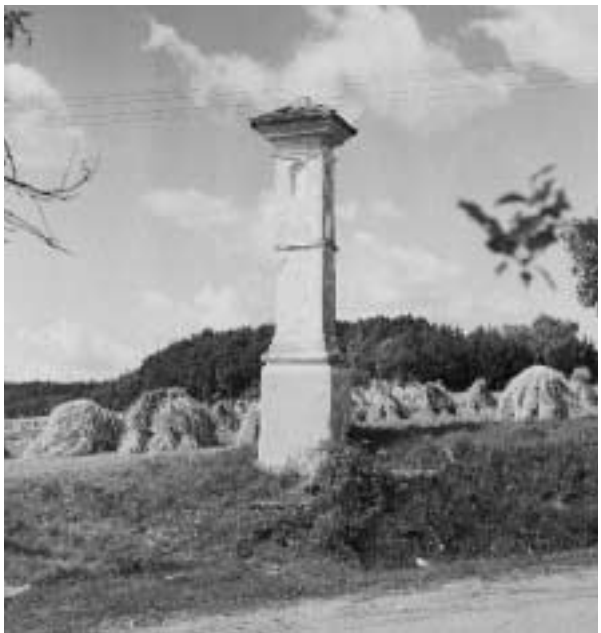
Kaplička u rybníka mezi vesnicemi Ra- díč a Dubliny, po- stavená na památku toho, že se tam kdysi údajně podařilo sed- láku Moulíkovi unik- nout spárům vodníka.