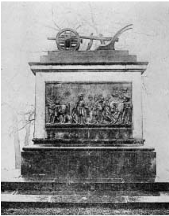
Pomník Přemysla Oráče ve Stadcích, postaven 1841.

a autoritám nebo dokonce pronásledované kacířství), mravní principy a postupně sílí národní povědomí. Tvořilo se to, čemu se dodnes říká zdravý selský rozum , i když tomu všemu bránily tisíce přežitky, vůle i zvůle vládnoucích vrstev, církevních kruhů či jenom těch nejnižších, ale všeho schopných místních hodnostářů.