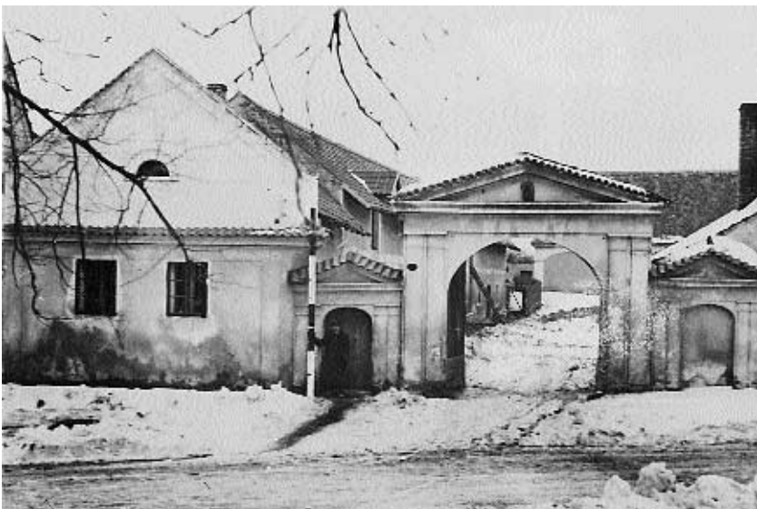
Fotografie zemědělských objektů na území Neveklov, určených k demolici, pořízená pro Německou osídlovací společnost r. 1942.

prostory ve středočeském kraji (část Benešovska, Neveklovsko a Sedlčansko) a obdobným způsobem na Moravě Vyškovsko, v obou případech regiony uprostřed výrazně českého prostředí. V těchto územích bylo nejprve z nařízení nacistických okupačních úřadů a zneužitých protektorátních soudů vykázáno a vyhnáno veškeré obyvatelstvo, v němž převažovali zemědělci, kterým byla odebrána půda i s obytnými a hospodářskými budovami. Na konfiskovanou půdu bylo v pozemkových knihách „vložen a vlastnické právo pro Německou říši, zastoupenou říšským vedoucím SS a šéfem německé policie“. Vstup do vyklizených a strážných prostor, kde se připravoval nebo již konal výcvik zbraní SS včetně ostré střelby a kde zemědělská výroba na vybraných usedlostech sloužila výlučně německým válečným potřebám, byl přísně zakázán; vyhnání starousedlíci nesměli navštěvovat a ošetřovat ani hroby svých příbuzných. Nikoho přitom nezajímalo, kde najdou vysídlenci práci a střechu nad hlavou. Kromě těchto regionů, z nichž byly vyhnány tisíce sedláků, malých a středních rolníků, zabraly okupační orgány pro Říši na 500 tisíc hektarů původně šlechtické a židovské půdy. Vyklizená území se měla podle nacistických plánů po vítězné Hitlerově válce stát ohnisky postupné germanizace všeho českého obyvatelstva.