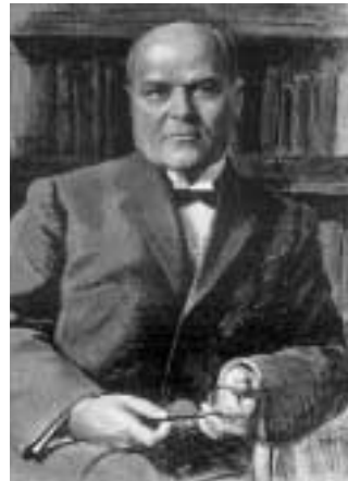
Portrét Antonína Švehly, předsedy agrární strany (1909–1933) a předsedy vlády (1922–1929).

Agrární strana vyrůstala již od 80. let devatenáctého století ze základu různých zemědělsko-hospodářských spolků. Pod vedením vůdčí selské osobnosti Alfonse Šťastného z Padařova se roku 1897 představila veřejnosti jako Sdružení českých zemědělců . V říšských a zemských volbách do zákonodárných sborů v předvečer 1. světové války byla už nejsilnější českou stranou a ve venkovských okresech neměla téměř žádnou rovnocennou konkurenci. V roce 1919 se přejmenovala na Republikánskou stranu československého venkova a v roce 1920 přijala definitivní název Republikánská strana zemědělského a malorolnického lidu , i když se jí zkráceně neřeklo jinak než agrární strana . Velmi rychle si vytvořila početnou voličskou základnu, která např. ve volbách do poslanecké sněmovny roku 1935 čítala 1 176 593 hlasů. Pod vedením schopného selského politika Antonína Švehly († 1933) měla rozhodující vliv v předválečných vládních koalicích, ovládala státní aparát, její představitelé zasedali ve vedení nejen zemědělských družstev a svazů, ale i v bankách a klíčových průmyslových a zbrojních podnicích a nemalými tlaky působila i na politiku prezidentů T. G. Masaryka