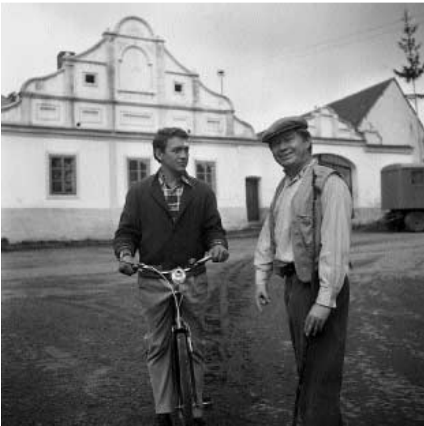
Barokní venkovská architektura – z filmu Tam, kde hnízdí čápi .