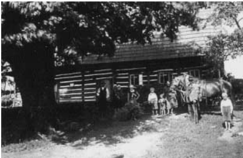
Dům rodiny Trojosky – Malý Uhřínov čp. 4.