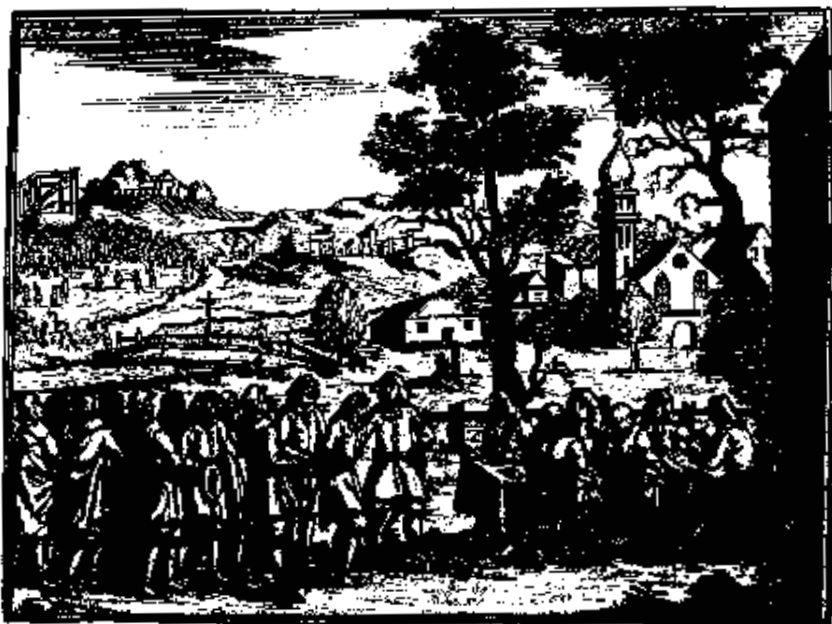
Soud nad nevolníkem – rytina z knihy Georgica curiosa , 1. díl, str. 52, vydáno v Norimberku.

povstání, v nichž přišly ke slovu i kosy a vidle. Proti nejznámějšímu z nich, které se v roce 1775 valilo z východních Čech na Prahu, zasáhla u Chlumce nad Cidlinou císařská armáda a krvavě je potlačila. Méně známé selské bouře se přehnaly Čechami už krátce po Bílé hoře, např. 1621 na Hradecku, 1627 na Konopištském panství, na Kouřimsku a Čáslavsku, 1628 na Opočensku. Roku 1639 vypukly selské bouře při vpádu Sasů do Čech na řadě statků, které byly po Bílé hoře odňaty české nekatolické šlechtě, a velké nepokoje se roku 1680 nesly téměř polovičkou českého království. Neúspěch neminul koncem 17. století ani chodské sedláky, kteří za svoji pohraniční strážní službu požívali jistých úlev a výhod, avšak nakonec doplatili na svoji důvěřivost k panovnickému trůnu a neobhájili svá domněle nezadatelná práva.