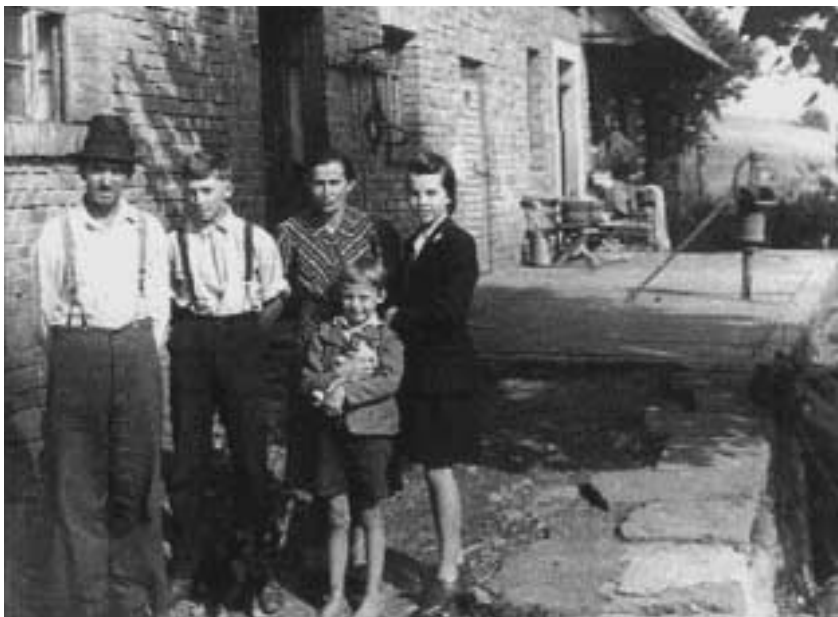
Rodina německého sedláka a starosty z Malého Uhřínova v Orlických horách v létě 1946 krátce před odsunem do Německa.