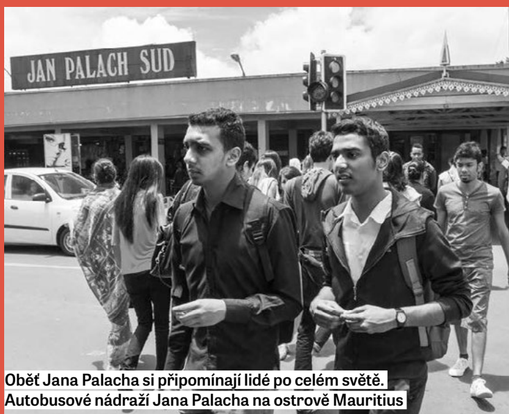
Oběť Jana Palacha si připomínají lidé po celém světě. Autobusové nádraží Jana Palacha na ostrově Mauritius