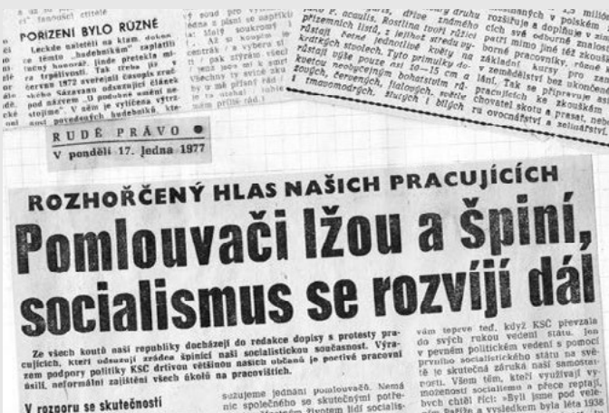
Komunistický režim na Chartu 77 zareagoval okamžitě pomlouvačnou kampaní