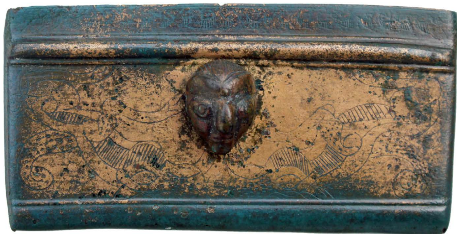
Obr. 2. Laténska opasková zápona. Našla sa počas výstavby bývalej cementárne (R. Čambal)

zovať. Mohla stáť bližšie k rieke Morave, vzhľadom na jej hospodársky a komunikačný potenciál, čo bolo pre vyspelé hospodárstvo Keltov určujúce. Z pohrebiska pochádza aj zaujímavá bronzová opasková zápona s reliéfnou ľudskou maskou (obr. 2), jedno z najatraktívnejších svedectiev umeleckého remesla včasnej doby laténskej v celej Európe. Na konci starého letopočtu sa Kelti pod tlakom Dákov presunuli do severoslovenských hôr.