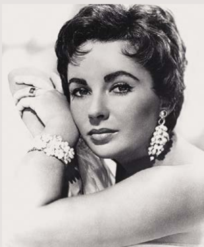
Leonardo da Vinci Elizabeth Taylorová