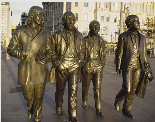
Beatles v Liverpoolu od sochaře Piera Heada