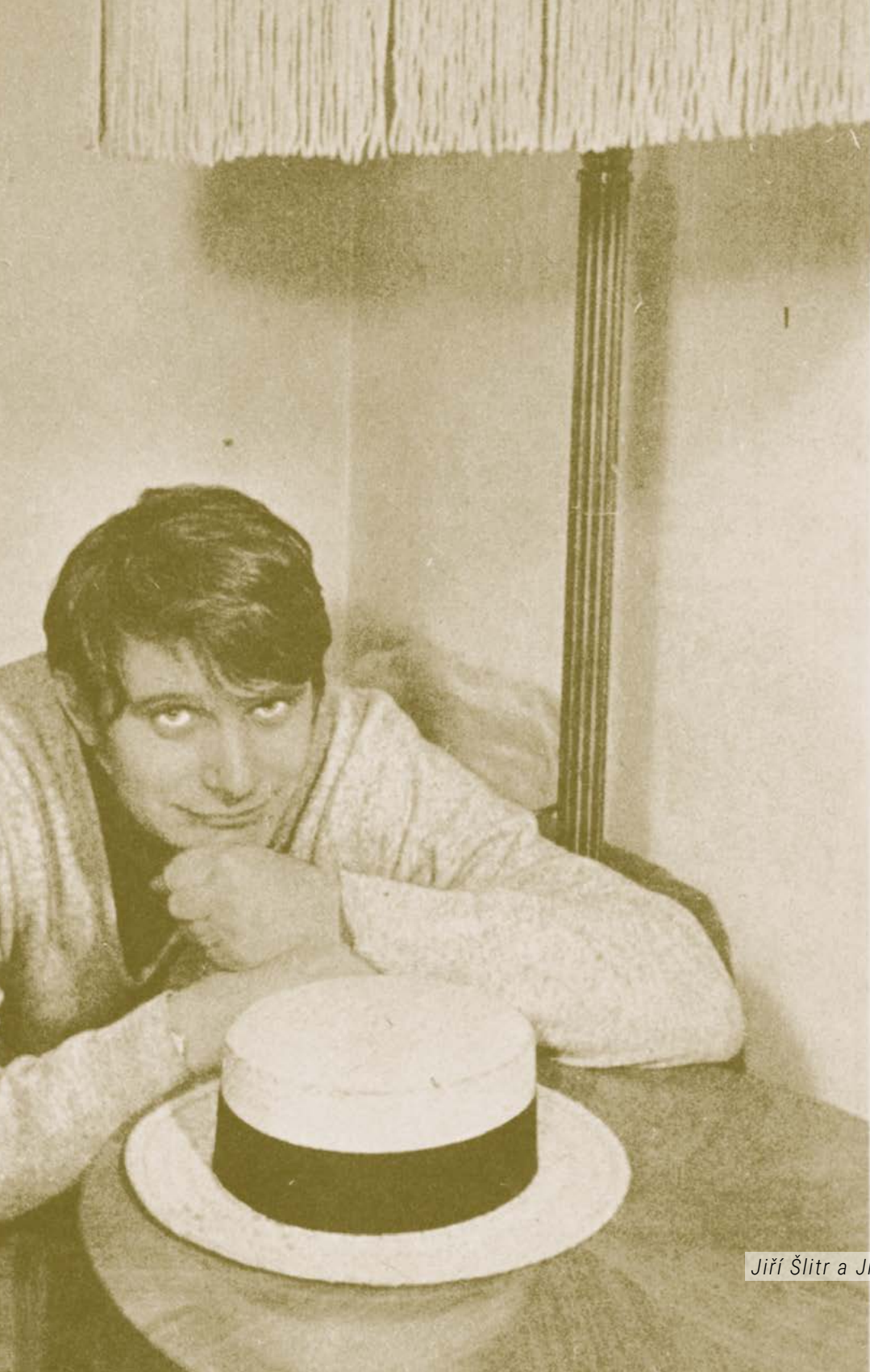
Jiří Šlitr a Jiří Suchý