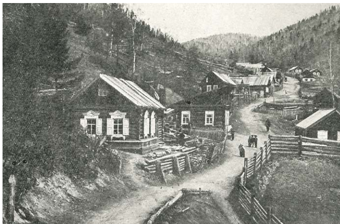
Vesnička v bajkalském pohoří v Janových dobách a dnes.