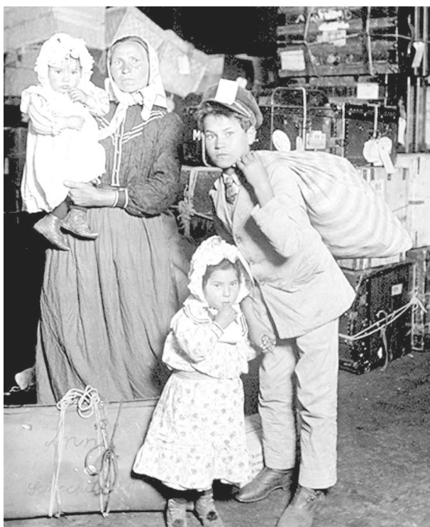
Slovenskí vystaňovalci na Ellis Island. Začiatok 20. storočia