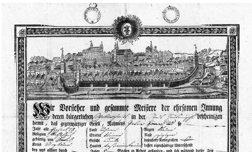
11. Albertovo sídlo, Litomyšl, na kovořezu z roku 1798

a podřízení pražskému arcibiskupství), nezbývalo než v prostoru českých zemí zřídít nové biskupství. Vzhledem k poloze obou církevních stolců v českých zemích byla vybrána lokalita ležící zhruba v polovině cesty mezi nimi, Litomyšl. Nebyla to jen geografická poloha, která rozhodla. Nové biskupství bylo třeba zabezpečit majetkově i infrastrukturou. V Litomyšli existoval premonstrátský klášter, jehož prostory a většina majetků byla odevzdána nově vznikajícímu biskupství. Klášterní kostel Panny Marie byl přeměněn na biskupskou katedrálu, biskup se usídlil v budově opatství, biskupské kapitule připadly další klášterní objekty. Většina členů klášterního konventu se stala členy biskupské kapituly. Při založení biskupství ale nebyly nikdy přesně vymezeny majetky a příjmy samotného biskupství a kapituly, což vedlo k vleklým konfliktům. Z pražského arcibiskupství byly pro litomyšlské biskupství vyčleněny farnosti chrudimského, poličského, lanškrounského a vysokomýtského děkanátu, z olomouckého biskupství farnosti z děkanátů šumperského a huzovského. 25