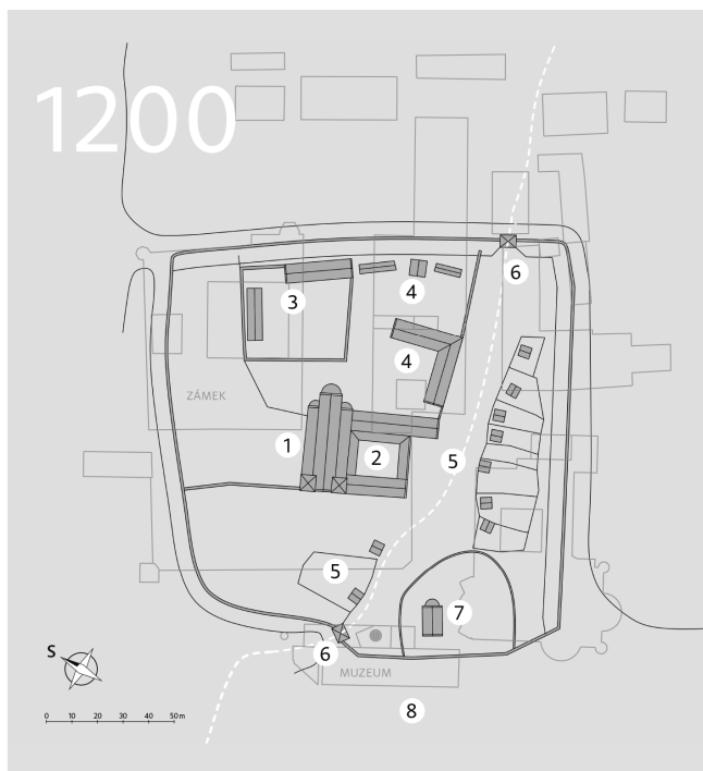
14. Předpokládaná podoba budoucího biskupského návrší v Litomyšli k roku 1200. Vysvětlení jednotlivých čísel: 1 – bazilika Panny Marie, 2 – klášter, 3 – opatský dvorec, 4 – hospodářské budovy kláštera, 5 – polozemnice, 6 – brány (dolní a horní), 7 – kostel sv. Klimenta se hřbitovem, 8 – klášterní litomyšlská osada

dosavadního litomyšlského biskupa Jana II. ze Středy (23. srpna 1364). Tím došlo k uvolnění místa litomyšlského biskupa. I zde měl Karel IV. jasně, na litomyšlský biskupský stolec zajistil dosazení zvěřínského biskupa Alberta ze Šternberka. 27