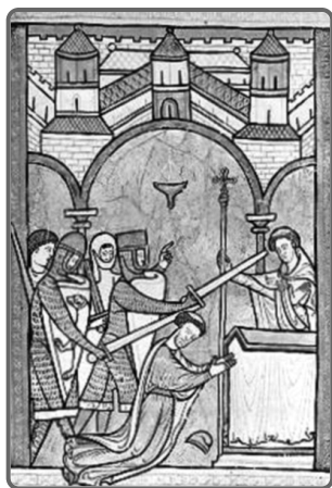
Další středověké zobrazení vraždy Tomáše Becketa.

Král se nakonec nechal canterburskými mnichy na důkaz svého pokání zbít holí a nakonec zcela vyčerpán nasedl na koně a odjel do Londýna. Ceremonie královy pokory byla u konce a pravdou je, že díky ní si opět mezi svými anglickými poddanými získal ztracenou vážnost.