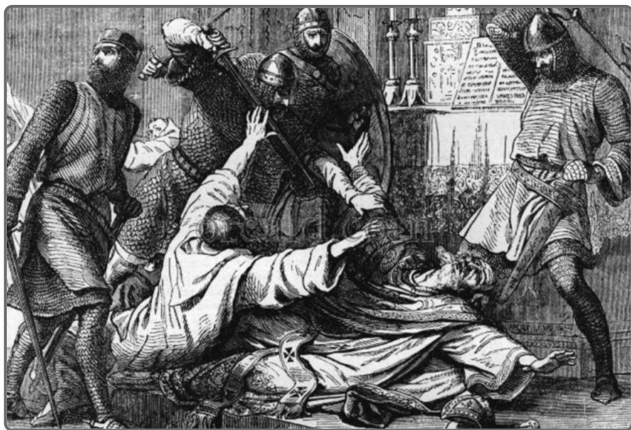
Mučednická smrt biskupa Tomáše Becketa v canterburské katedrále mu nakonec vynesla svatořečení.

Když rytíři odcházeli, krve by se v nich nedořezal. Co to provedli? Zabili světce. Až se to dozví král, krev mrtvého arcibiskupa může padnout na jejich hlavy! Ale kdyby se tak zuřivě nebránil, mohlo to dopadnout jinak, přijeli ho přece jen zajmout a dopravit k panovníkovi, který by pak sám rozhodl o jeho dalším osudu.