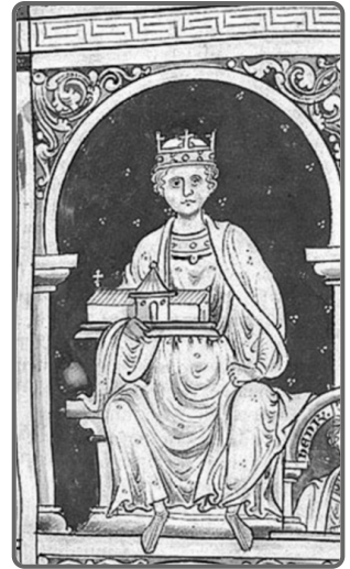
Anglický král Jindřich II., jemuž Tomáš Becket věrně sloužil jako kancléř.

V těch časech však byli ještě přáteli a král se na svého kancléře mohl ve všem spolehnout. Jindřich II. k němu pociťoval důvěru, vždyť Becket mu byl za své povýšení zavázán a vysoký úřad, který zastával, plnil k jeho naprosté spokojenosti. Navíc byl nejbližším královým rádcem i oddaným spolubojovníkem v bitvách, které musel v Anglii Jindřich II. se svými odpůrci svádět. Jak mohl tenkrát anglický král tušit, že si v tomto vychytralém klerikovi, kterého mu doporučil tehdejší canterburský arcibiskup Theobald, hřeje na prsou hada?