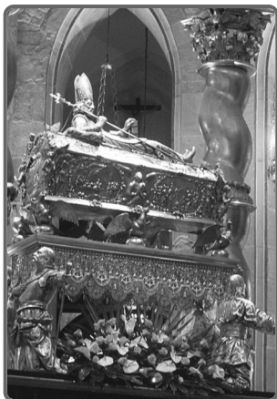
Náhrobek s ostatky svatého Vojtěcha v polském Hnězdně.

Z Německa pak zamířil k polskému panovníkovi Boleslavu Chrabrému, kde se chtěl setkat s bratrem Soběslavem, který zde po libické tragédii našel azyl. Soběslav žádal polského krále, dávného spojence a přítele Slavníkovců, aby mu dal k dispozici vojsko. S ním chtěl vtrhnout do Čech a pomstít se Přemyslovcům a Vršovcům za masakr na Libici. Ale Boleslav Chrabrý váhal: svou vlastní vojenskou intervenci proti českému knížeti sice sám plánoval, ale zatím měla ještě několik let počkat.