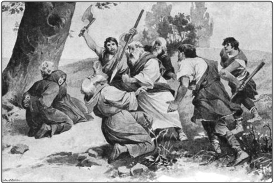
Zavraždění biskupa Vojtěcha na jeho misionářské cestě v pohanském Prusku (obraz Věnceslava Černého).

Tento německý panovník byl totiž vzdělaný, zbožný a okamžitě poznal, že má před sebou stejně vzdělaného, a navíc moudrého muže, s nímž mohl otevřeně diskutovat o čemkoli – o církevních otázkách i politice. Vojtěcha se od jeho rozhodnutí působit mezi pohanskými Prusy snažil přemluvit, neboť o nich kolovaly zvěsti, že s křesťany nemají slitování, ale biskup už byl rozhodnutý. Půjde právě tam, ať už se stane cokoli.