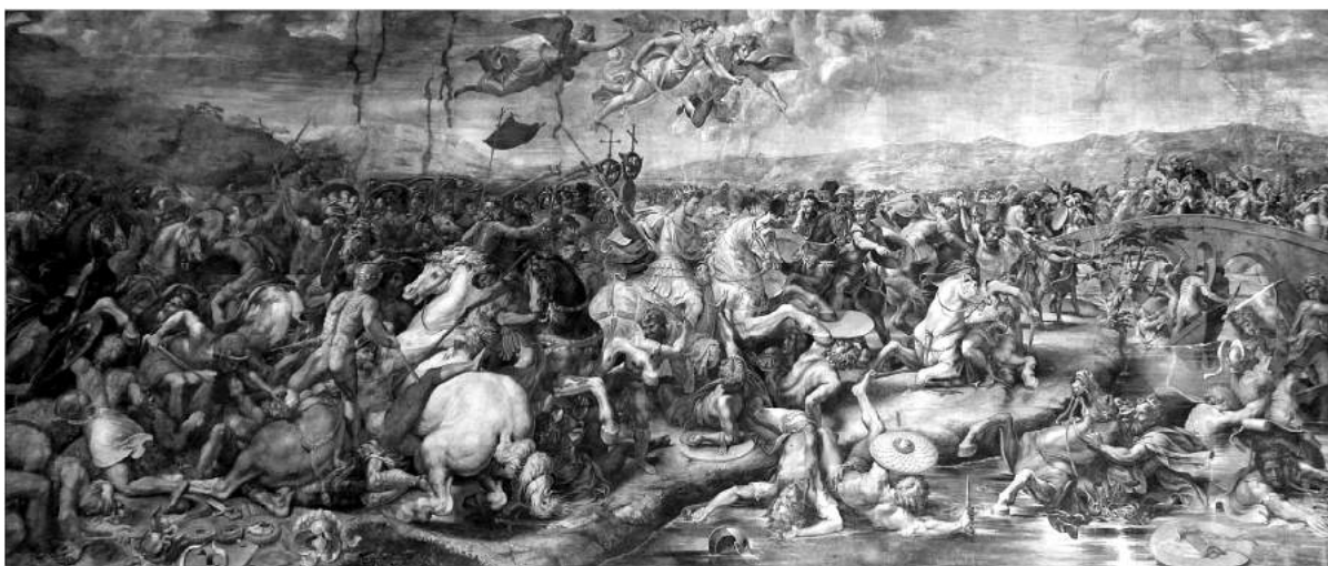
Obrázek 2: Bitva u Milvijského mostu roku 312, Giulio Romano roku 1524