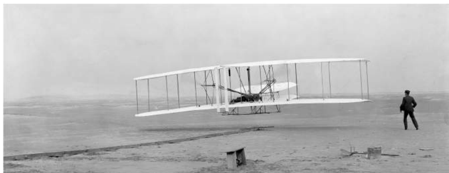
Obrázek 82: První dokumentovaný let motorového letadla bratří Wrightů z roku 1903

terie pro dva elektromotory, pohánějící podvodní koráb pod vodou.