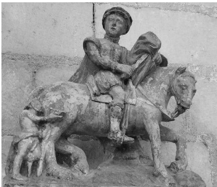
Obrázek 1: Sv. Martin se dělí o svůj plášť. Kamenná socha v klášteře Saint-Germain v Auxere z konce 14. století

Projížděli územím, kde žili Románi, Galové i Germáni – nejčastěji Frankové, kteří zde byli přesídleni Constantiem I. Chlorusem. Byli to sice zajatci (laeti), ale za to, že slíbili vojenské služby Římu, obdrželi půdu, nejčastěji v okruhu do patnácti kilometrů od města, jehož okolí tak lemovala prostá dřevěná stavení, dlouhé domy, kde společně žili lidé a ustájený dobytek. Okolí domů obklopovala malá, ale četná políčka. Předměstí silně kontrastovalo s římským městem, jehož brána, skrývající nejen kamenné domy, ale i fórum o rozloze přes 50 000 metrů čtverečných, lázně a amfiteátr pro patnáct tisíc diváků, byla na dohled. Stráž u brány již jezdecky zahlédla a připravila se na jejich přijetí. Elitní vojáci se zatím nemuseli při